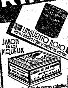
UNGUENTO ROJO para caballos, perros y diversos usos JABON de LOS PIQUEUX Nº1 - Para limpieza de perros, caballos y expulsión de sus parásitos. Nº2 - Para perros de casa y creaciones bonitas de la piel. Nº3 - Necesario en la curación de enfermedades parasitarias (roña, oideos, etc.)