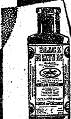
BLACK MIXTURE Llagas de toda naturaleza