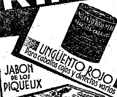
JABON DE LOS PIQUEUX