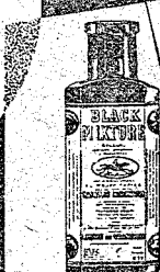
BLACK MIXTURE Llagas de toda naturaleza