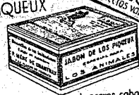
№1-Para limpieza de perros, caballos y expulsión de sus parásitos. №2-Para perros de caza y afecciones berriñas de la piel. №3- Necesario en la curación de enferme- dades parasitarias (rona, úlcera, etc.)