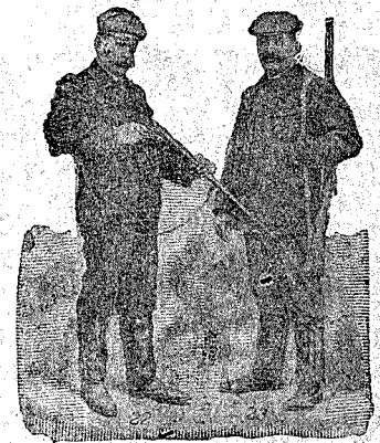
Figura 22. Chaquetón de dos filas, solapas grandes, acolchado, ribetes de paño, para más duración, en edredón azul, negro ó café, 60 pesetas.—Figura 23. Prusiana, montañac inglés, de gran lujo y mucho abrigo, va ribeteada de fino paño, 80 pesetas. Forrada en pieles de Holanda, en negra 140 pesetas. En gris ó marrón, 180 pesetas. En rasé, imitación á nutria, 225 pesetas.

DE NUESTRO CATALOGO DE PRENDAS DE CAZA, CAMPO Y SPORT