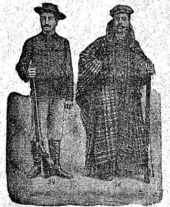
Figura 24. Marsellés, color café, para caza cuello, camisa, de terciopelo, sin adornos, 40 pesetas, adornadas, 60 pesetas.—Figura 25. Capote, juego damas, con cuello de piel y flecos, va abierto hasta la cintura, con aplicación para viaje y campo. En dos colores combinados azul y gris ó café con encarnado, 40 pesetas.

Figura 22. Chaquetón de dos filas, solapas grandes, acolchado, ribetes de paño, para más duración, en edredón azul, negro ó café, 60 pesetas.—Figura 23. Prusiana, montañac inglés, de gran lujo y mucho abrigo, va ribeteada de fino paño, 80 pesetas. Forrada en pieles de Holanda, en negra 140 pesetas. En gris ó marrón, 180 pesetas. En rasé, imitación á nutria, 225 pesetas.