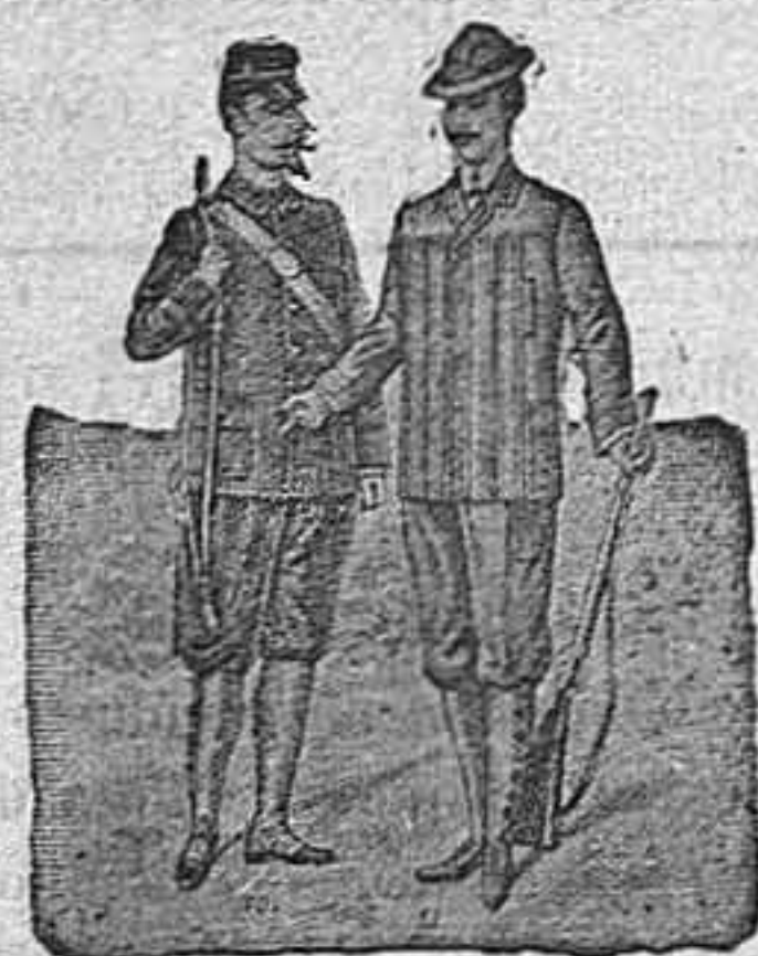
Figura 10. Traje de pana bronce, con pantalón de puño ó ceñidor de goma, en pana del país, 70 pesetas, alemana, 115 pesetas, inglesa 125 pesetas.—Figura 11. Traje de cheviot, de fantasía, botones de cuero, 80 pesetas.

DE NUESTRO CATALOGO DE PRENDAS DE CAZA, CAMPO Y SPORT