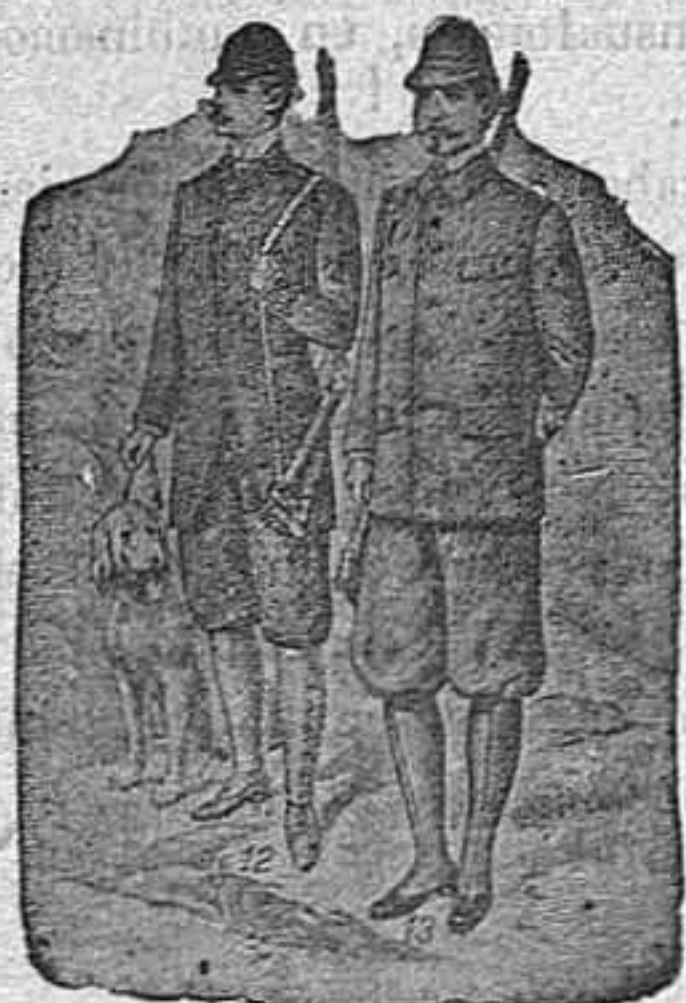
Figura 12. Traje de chaquet, á la inglesa, con pespuntos anchos, con aplicación á la caza y al sport hípico, para polaina, 120 pesetas.—Figura 13. Traje de tela impermeable, con capucha de lo mismo, para encima de otra prenda, todas las costuras van cosidas y pegadas, para que no penetre el agua. Hay variedad de dibujos y colores, todos nuevos, 90 pesetas.

Figura 10. Traje de pana bronce, con pantalón de puño ó ceñidor de goma, en pana del país, 70 pesetas, alemana, 115 pesetas, inglesa 125 pesetas.—Figura 11. Traje de cheviot, de fantasía, botones de cuero, 80 pesetas.