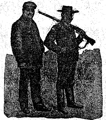
Figura 18. Chaquetón mallorquín, sin forros. En azul, café, gris claro y gris obscuro, de mucho abrigo, 30 pesetas.— Figura 19. Marsellés, cuello forma chal, adornado con paño negro, coderas y golpes de pasamanería fina, en paño azul, negro, café ó bronce, 60 pesetas.

DE NUESTRO CATALOGO DE PRENDAS DE CAZA, CAMPO Y SPORT