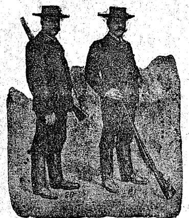
Figura 20. Chaquetón de solapas, con coderas y ribetes de elasticotín negro, en ratinas fuertes y de abrigo, en azul, negro y café, 60 pesetas.— Figura 21. Marsellés, cuello marinera, muletillas de pasamanería fina, con coderas y caídas bordadas en paño, adornado de serpentinas de seda, 75 pesetas.

Figura 18. Chaquetón mallorquín, sin forros. En azul, café, gris claro y gris obscuro, de mucho abrigo, 30 pesetas.— Figura 19. Marsellés, cuello forma chal, adornado con paño negro, coderas y golpes de pasamanería fina, en paño azul, negro, café ó bronce, 60 pesetas.