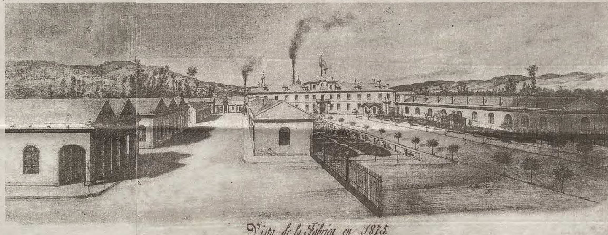
Vista de la Fábrica en 1875.

El plan atravesó primero una fase de discusión para dirimir si su ejecución correspondía al Arma de Artillería o bien al de Ingenieros. Finalmente recayó en el segundo, confiándose el proyecto al «comandante capitán» Felipe Martín del Yerro que lo firmó el 21 de agosto de 1874. La falta de las 25.000 pesetas comprometidas por la ciudad obligó a simplificar varios detalles. En las trazas aprobadas se perciben las bases de la arquitectura militar del XVI replanteada ante el auge de la artillería por muchos tratadistas (Pietro Cataneo, De Marchi, Filarete, Durero, etc.), que concibieron racionales sistemas defensivos para ciudades y recintos. En España uno de aquellos teóricos fue Cristóbal de Rojas (ca. 1551-1614), ingeniero militar de origen toledano que, en 1598, editó la Teórica y práctica de fortificación , dedicada al príncipe Felipe III.