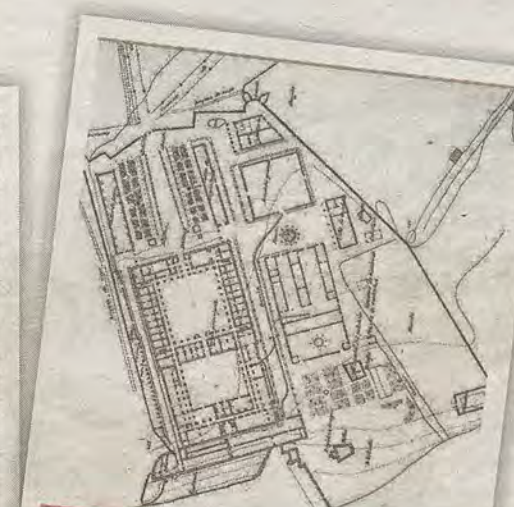
Conjunto de la Fábrica de Armas a finales del siglo XIX