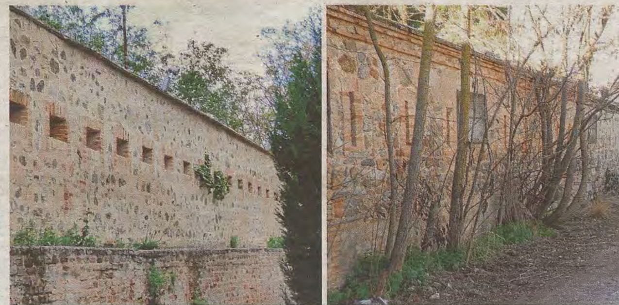
Exterior e interior actual de uno de los baluartes con el recuerdo de las antiguas taquillas para el cine de invierno

En la segunda mitad del XX estas fortificaciones aportarían su último cometido a algo más prosaico: evitar que nadie se colase en el cine de invierno habilitado en una nave interior. Para ello, en uno de los baluartes, se abrieron una puerta y dos taquillas cuyas huellas aún persisten. Portereros y «rondines» tamizaban aquí el acceso del público para ver «El Gordo y el Flaco» y una del Oeste. Por motivos de seguridad también quedaba fuera del recinto fabril la modesta industria del puesto de pipas.