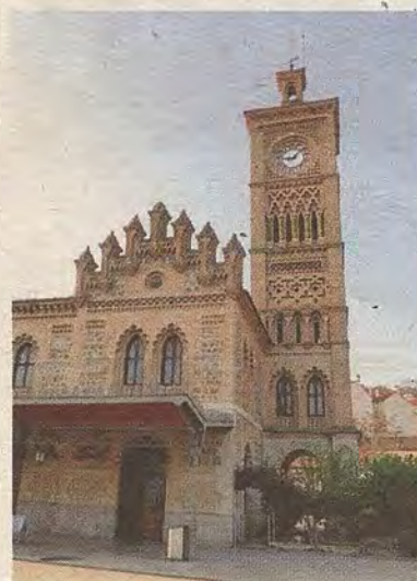
Entrada a la capilla (antes Salón de Honor) desde el andén. A la izquierda, alzado y planta de la torre y del Salón de Honor. Arquitecto, Narciso Claveriacillo de San Bartolomé