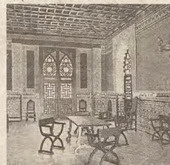
Interior del Salón de Honor en 1920. Foto: Clavería. Rev. Abajo, Toledo Paso inferior al Salón de Honor bajo la torre. Foto Clavería. Rev. Toledo