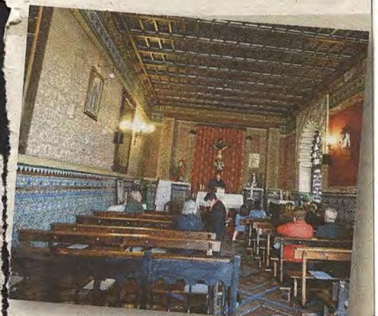
Salón de Honor, hoy capilla abierta al culto. Tras el crucifijo se sitúa la puerta a la fachada principal. Cubre-radiador cincelado por J. Pascual en 1919 para el Salón de Honor.