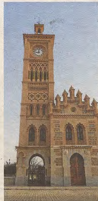
Accesos exteriores al andén y al Salón y cuatro detalles de la bóveda bajo la torre

La espléndida publicación Toledo. Revista Semanal de Arte (dirigida por Santiago Camarasa), ofrecía el 15 de