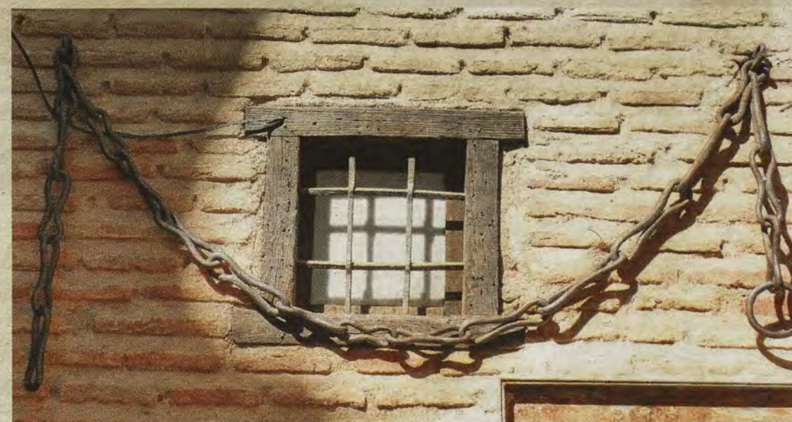
Cadenas colocadas junto a la entrada del que fue Museo de Arte Contemporáneo