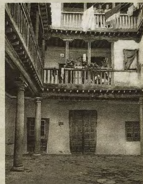
Patio de las Casa de las Cadenas hacia 1930.

ABC DOMINGO, 17 DE SEPTIEMBRE DE 2017 abc.es/espana/castilla-la-mancha/toledo