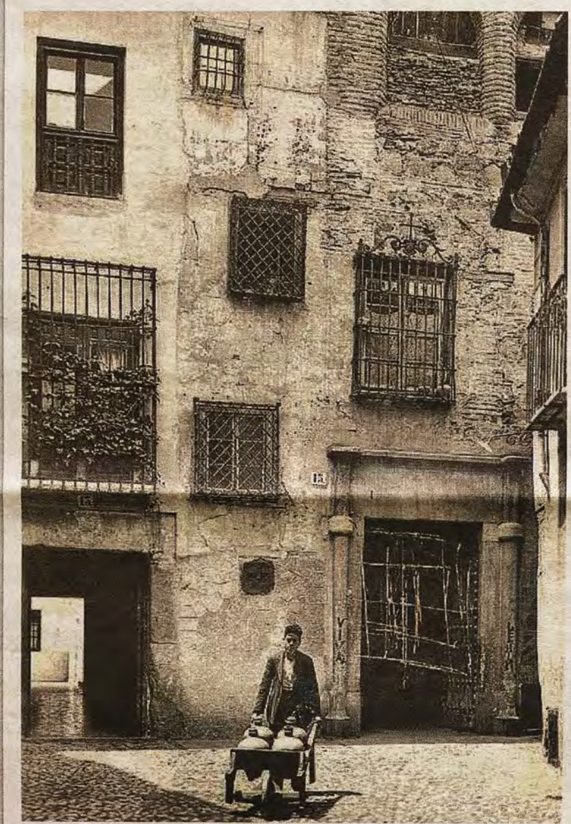
La calle de las Bulas hacia 1935. A la izquierda acceso a la casa que acogió el Salón Echegaray . Postal Ed. FM. (Archivo Municipal de Toledo)

Estos hechos pueden explicar que, en la mitad de la referida calle, aún pervivan contiguos dos elementos de distinto sello: un viejo adarve judaico y una propiedad de la pequeña nobleza local. El primero es el callejón sin salida de Esquivias que, como otros de la ciudad, reunía en su tramo final varias viviendas y la posibilidad de cerrarse el acceso con alguna puerta o cancela en la embocadura del adarve. El segundo elemento es el edificio ya citado de Casa de la Cadena o, en plu-