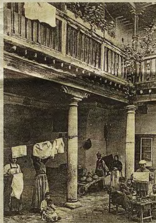
Vecinos de la Casa de las Cadenas hacia 1915.