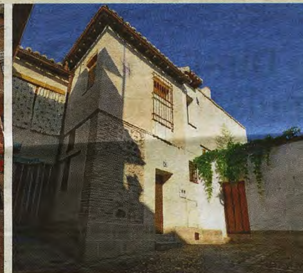
Puerta posterior de la Casa de las Cadenas en el callejón de Siete Revueltas

Desde finales del XVIII, como tantos palacios y caserones toledanos, debió comenzar su declive, al alejarse sus propietarios hacia la Corte, dejándose en arriendo subdividido a varios inquilinos. Aunque se mantenía la estructura general de la casa, los vecinos, en la media que podían, acomodaban cada rincón a sus necesidades y oficio. Una postal comercializada por Abelardo Linares, hacia 1915, recrea la vida diaria en este patio de la calle de las Bulas con mujeres, niños, un aguador y un zapatero, ambiente repetido, durante varias décadas, en múltiples casas toledanas. Digamos que el número 13, contiguo a la Casa de las Ca-