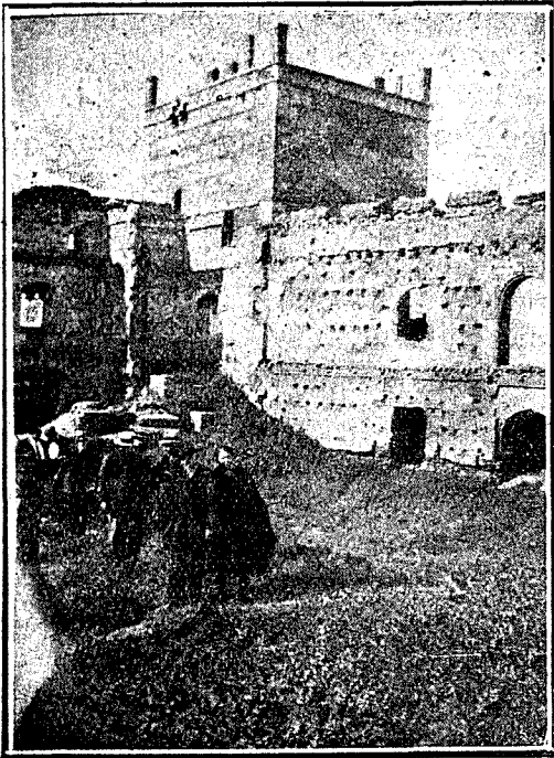
ESCALONA: Los maestros del partido y las nuevas Escuelas nacionales.

De los pueblos pertenecientes a dicha agrupación acudieron bastantes Maestros y algunos de la capital