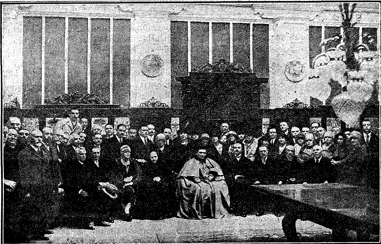
El Sr. Cardenal, su señora madre, la Inspección y los Maestros toledanos.

El Prelado glosó las palabras de Jesucristo cuando dijo: la paz sea con vosotros. Recordó pasajes de su vida llena de tristezas y de alegrías que precisamente en día tan solemne para él se entremezclaban opri-