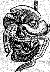
Fig. 5 Aparato digestivo