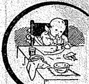
En el Raquitismo

que consumen poco a poco al enfermo y terminan en el abatimiento, impotencia y prostración general, desaparecen al poco tiempo con el uso de este específico, notándose ya desde las primeras tomas un aumento de fuerza y de agilidad que ponen rápidamente al enfermo en estado de completa curación.