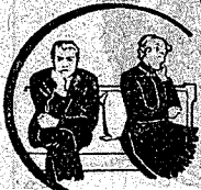
En la Neurastenia

o debilidad nerviosa por agotamiento, produce este ELIXIR efectos admirables. Los dolores profundos de cabeza, fatiga, insomnio, dolores medulares, desarreglos gástricos y demás padecimientos