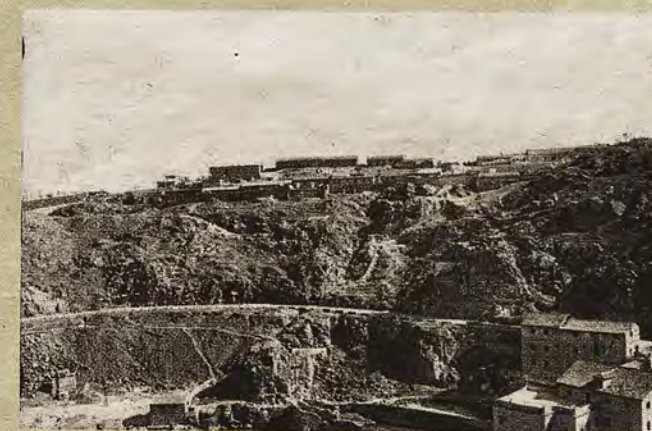
Barrio de San Blas, inmediato al castillo de San Servando, hacia 1935.