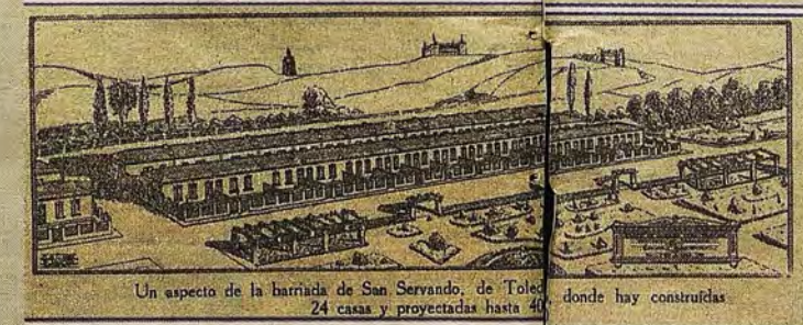
Hoja publicitaria de El Castellano (1928) con el proyecto de la barriada de San Servando. Archivo Municipal de Toledo.

Primo de Rivera para funcionarios municipales (1925) o por compañías y entidades diversas. Solían ofrecer varios tipos de edificios y acabados. Unas reunían pequeños hotelitos aislados de cierto empaque, otras alzaban casas unifamiliares adosadas en hilera, con una o dos alturas, a base de materiales baratos y sencillos: ladrillos, cal, madera y tejas industriales. Claves que también se verían en la «barriada de San Servando» de Toledo.