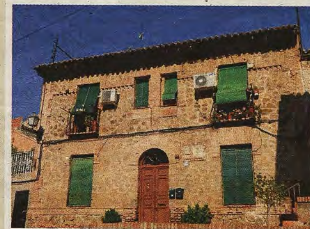
Entrega de una casa del Banco de Ahorro en Toledo en 1924 y la misma en la actualidad