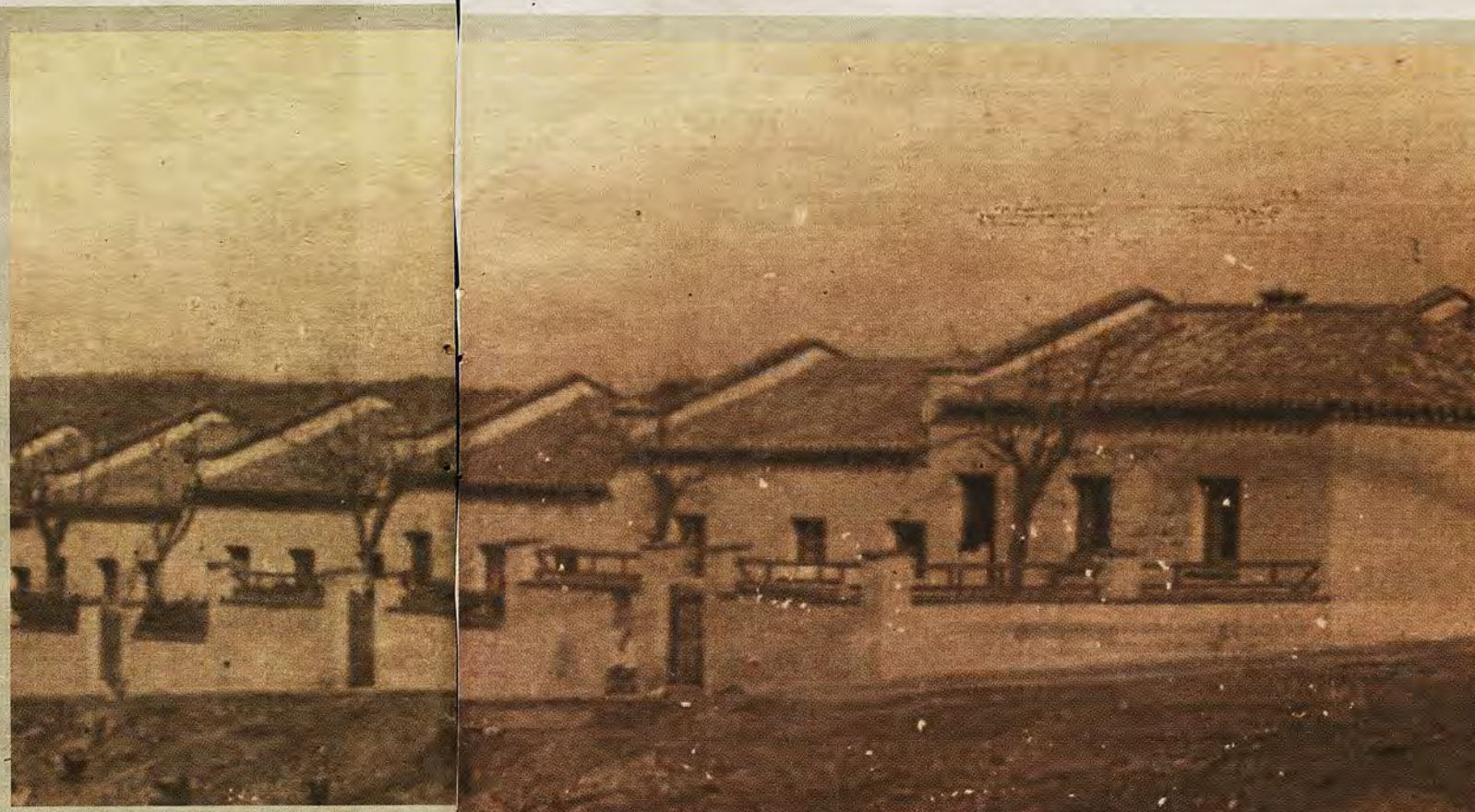
Casas de la barriada promovida por el Banco de Ahorro y Construcción hacia 1943.

DOMINGO, 27 DE MAYO DE 2018 abc.es/espana/castilla-la-mancha/toledo