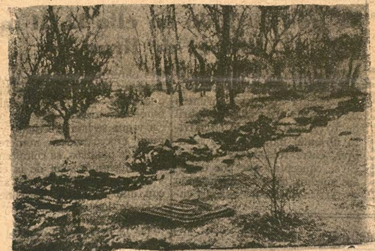
Miseria y muerte: He aquí el programa de Moscú y he aquí lo que quieren los rojos que sea España.

Moscú.—La sinceridad de "Isvezia" alcanza alguna vez el descubrimiento de trucos diabólicos que se cometen imprudentemente en el denominado régimen del pueblo. El diario oficial gubernativo, en efecto, publica