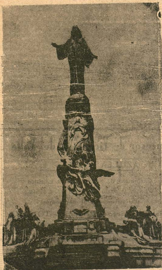
Cerro místico, de un reino espiritual de Cristo en España. Hoy no vendrán ya los romeros a arrodillarse ante la imagen venerada ni el eco devolverá las plegarias y cantares piadosos. El Cerro de los Angeles ya no se cubrirá hoy de peregrinos. Su tierra sangrada por las granadas muestra al aire sus manchas de pólvora y sus entrañas calcina. Los lloran el sacrilegio cometido