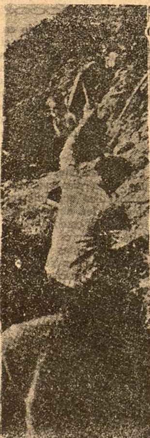
Nuestra artillería bate el 'cinturón de hierro'; de hierro español sacado de las entrañas de España y puesto por traidores separatistas al servicio de Moscú.

Ya han empezado hace tiempo a pagar su traición trabajando a latigazos en las fortificaciones los que no pueden llevar sus armas a las líneas de fuego, mientras los jóvenes, a latigazos también, sostienen en las manos sus fusiles frente a España