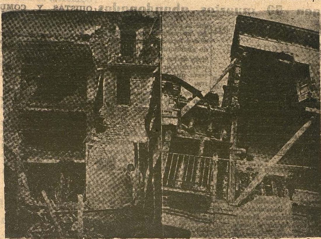
Ruinas de Huesca, la mártir