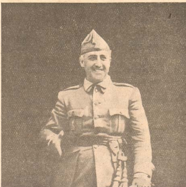
El Generalísimo del Ejército y Jefe del Estado español, Francisco Franco Bahamonde

Y cuando rodeado de un mundillo de uniformes con estrellas, cercado por el pueblo de Toledo, Franco sentaba el pie