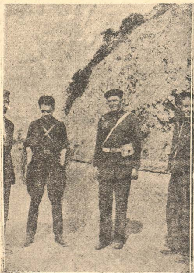
También los guardias municipales tienen su odisea en esta guerra. Este es el primer guardia municipal que se evadió de Bilbao, cuando aún la ciudad no era de España.

De ello es prueba clara que batallones enteros que se aproximan al millar de hombres están esperando la ocasión de pasarse a nuestras líneas.—LOGOS.