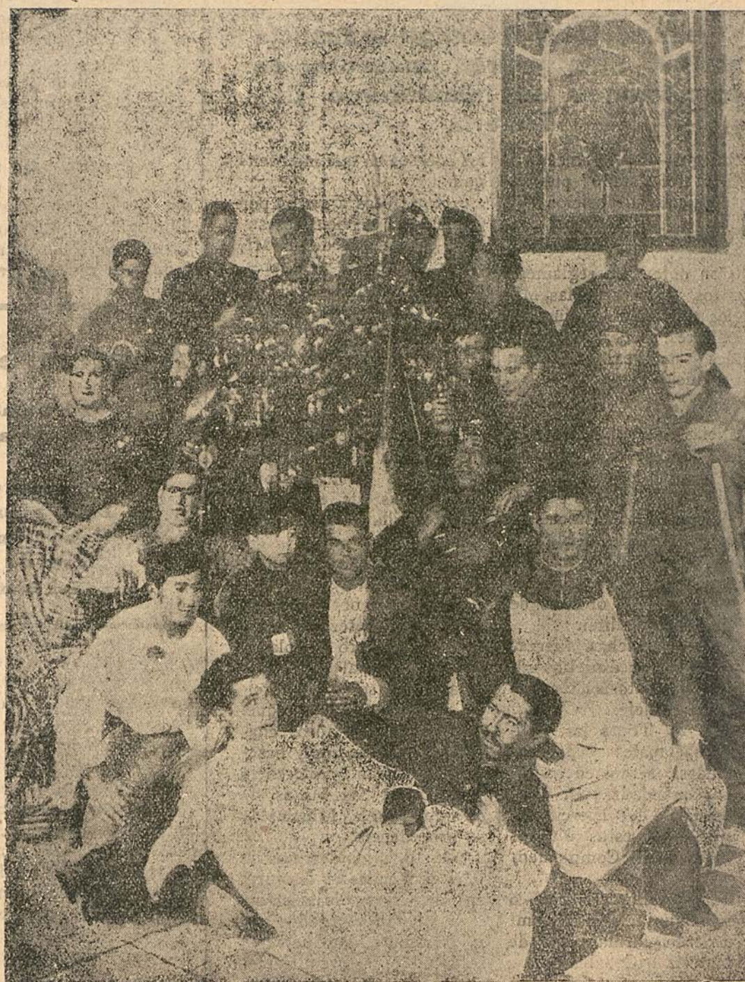
El hospital de sangre de Toledo recogió risas y villancicos en torno del árbol de Navidad