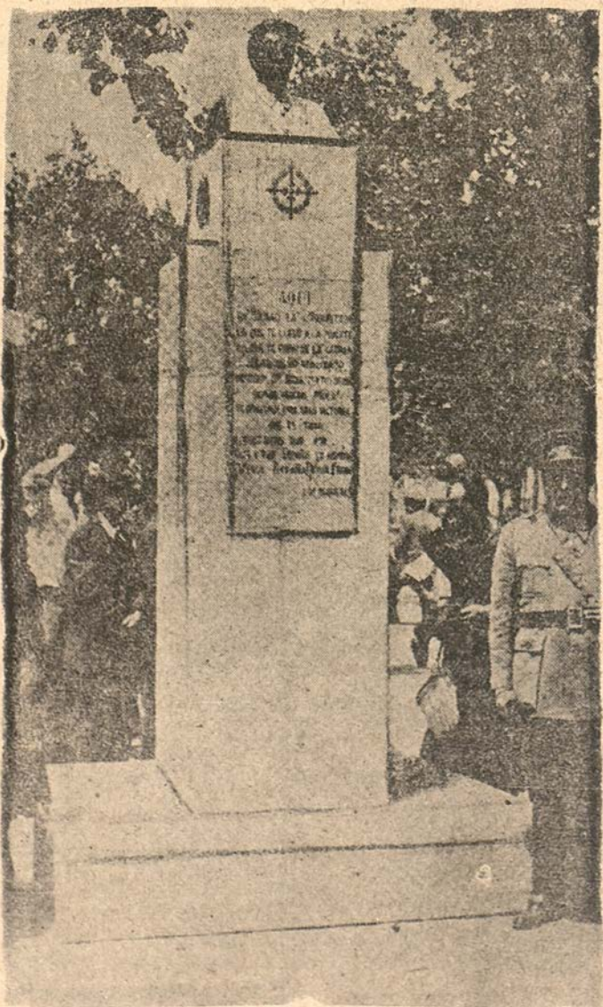
Bilbao libertado. Este es el monumento que, en el espacio de pocas horas, alzaron en Bilbao los Requetés para perpetuar la memoria del glorioso General Mola, libertador del país vasco

Pese al control durante la semana última llegaron centenares de cajas con pretexto de alimento para la población civil, ametralladoras, cartuchos, cañones; hemos cogido cinco grandes depósitos de material de guerra, innumerables depósitos en todos los frentes establecidos. Sólo de dinamita pasan de cien las toneladas aprehendidas. Hasta ayer fueron llevados a la retaguardia 37 camiones abarrotados de material. Se asegura que con el material que queda podrán cargarse más de 400 camiones. Esto sin contar los inmensos depósitos de gasolina,