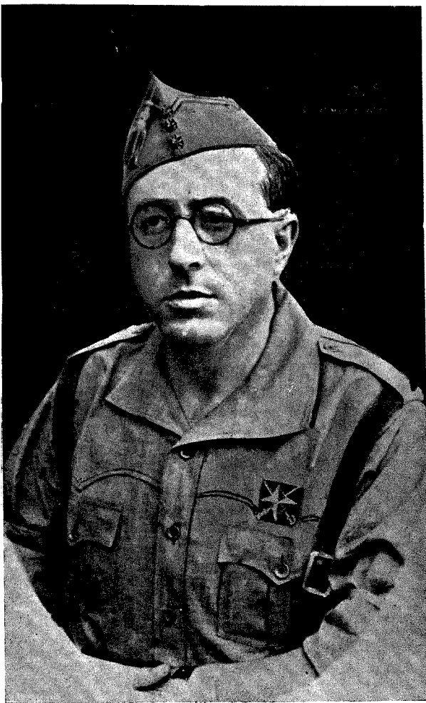
Fotografiado Guzmán Do Rego

Todo tu dinero no vale lo que una gota de sangre que, entre vítores a la Patria, derraman los que en las trincheras la defienden. No podemos tolerar tacaños de dinero donde hay tantos rumbos de sangre.