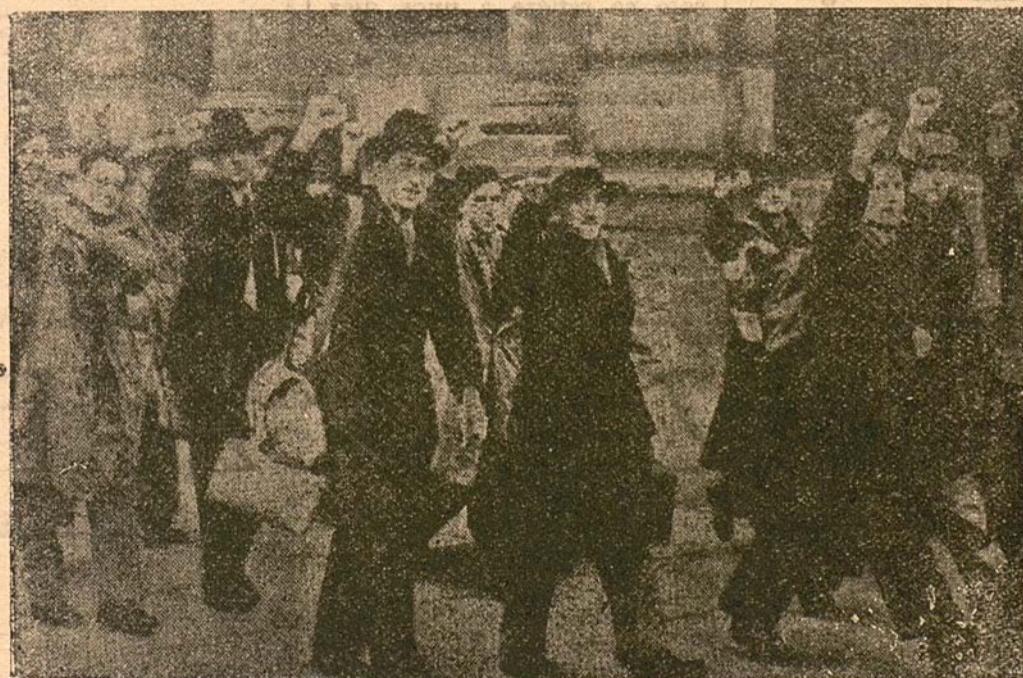
Un grupo de comunistas ingleses alistados para combatir en España se preparan para el embarque