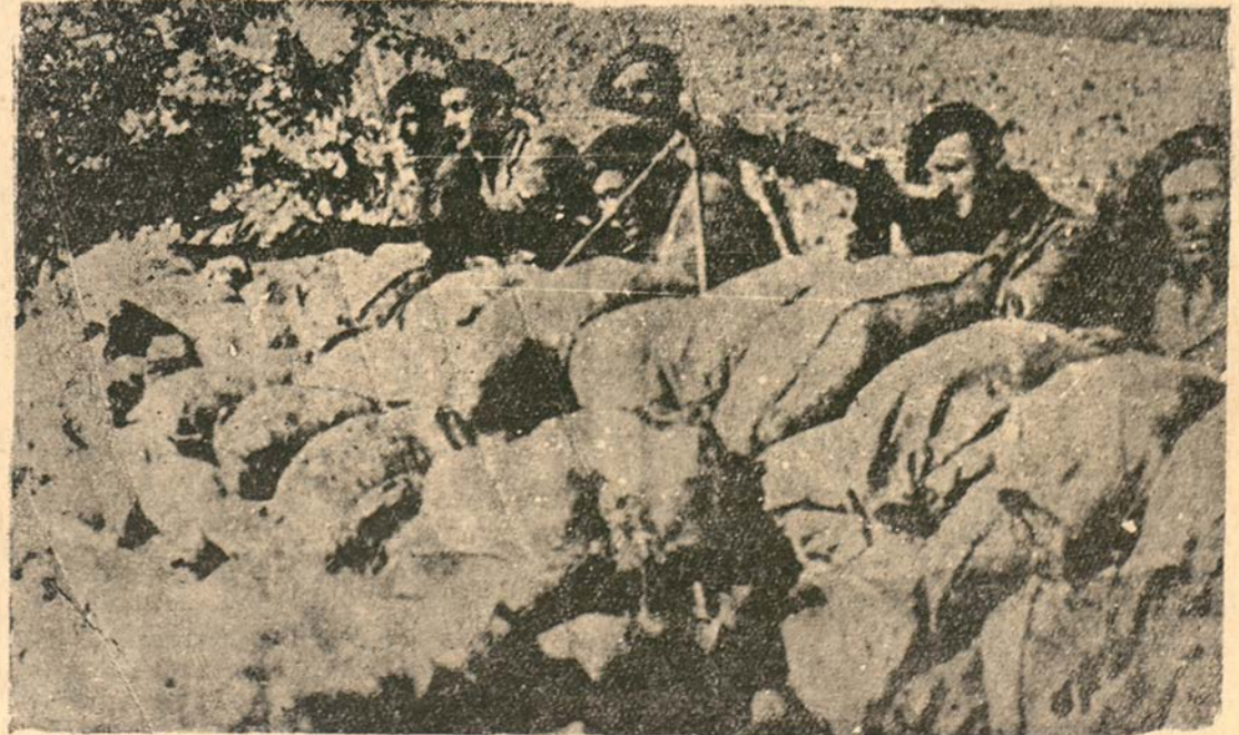
Un parapeto en el frente de Vizcaya

tes de uno de los batallones que intervinieron en la operación. Entre ellos figuran los nombres de tres tenientes, dos de ellos eran albañiles y el tercero pintor, afiliados a la UGT. Hoy, en Las Navas, dieron nuestros soldados una fiesta para celebrar la victoria y la entrega de un bastón de mando al teniente coronel jefe de las fuerzas de este sector; la jornada en todo el frente ha transcurrido sin la menor alteración. Las brigadas, y con ellas las esperanzas, y las desesperanzas están dispuestas, y están pendientes de lo que sucede en Vizcaya.—LOGOS.