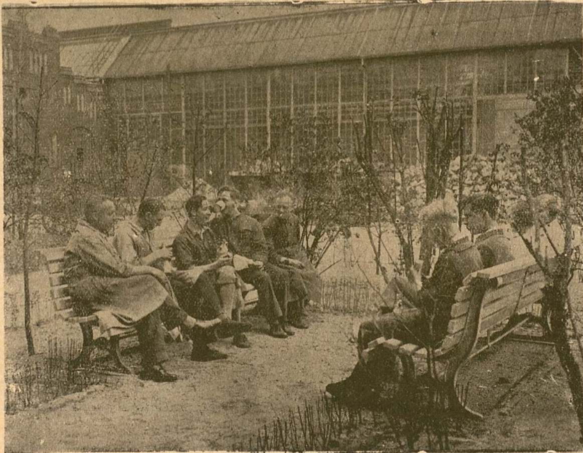
Ahora la oficina [de] belleza [del] trabajo cuida de que se arreglen jardines y bancos en los terrenos de las fábricas, que se hallan a la disposición de todos los que trabajan en la empresa