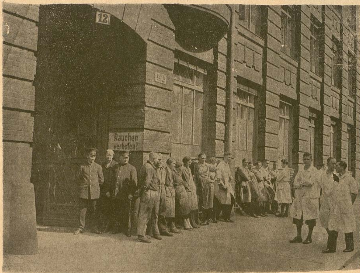
Antes, cuando los trabajadores tenían un descanso y querían disfrutar del sol y del aire, habían de salir a la calle

Lo que el Servicio de Trabajo, bajo la dirección del señor Hierl, es moral y espiritualmente para la renovación del pueblo alemán, no es necesario explicarlo con más palabras. La idea de "burgués" y "proletario" ha desaparecido en gran parte en Alemania gracias a sus efectos. La juventud alemana no conoce sino un sentido único en la palabra "alemán". Junto a esto, como cosa de menor valor del Servicio de Trabajo, está el "fortalecimiento corporal", la educación física de la juventud alemana. La vieja sentencia latina: "mens sana incorpore sano", ha sido de tal forma puesta en práctica por el Servicio de Trabajo que visitantes extranjeros hablan siempre de él como sistema