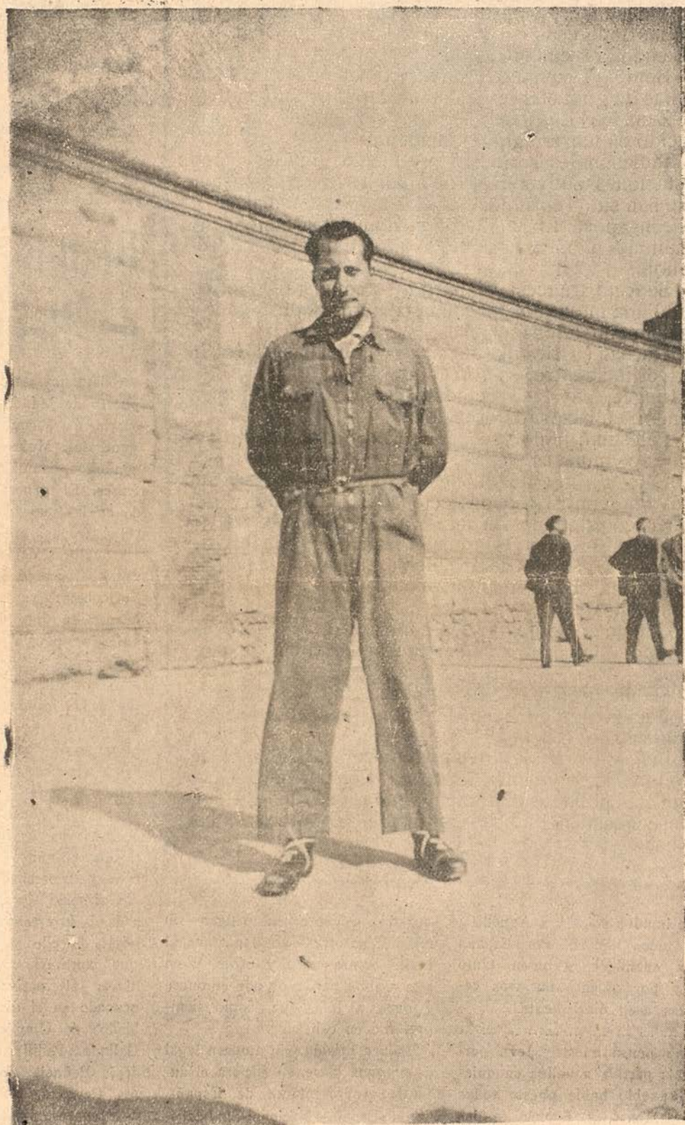
José Antonio Primo de Rivera, en el patio de la cárcel

Fecha de Falange. Un día de tinieblas españolas, en el que pretendieron separarnos de ti; pero la separación geométrica sólo consiguió acercarnos más a tu espíritu; y así fué como tu prisión decretó la libertad de la Patria.