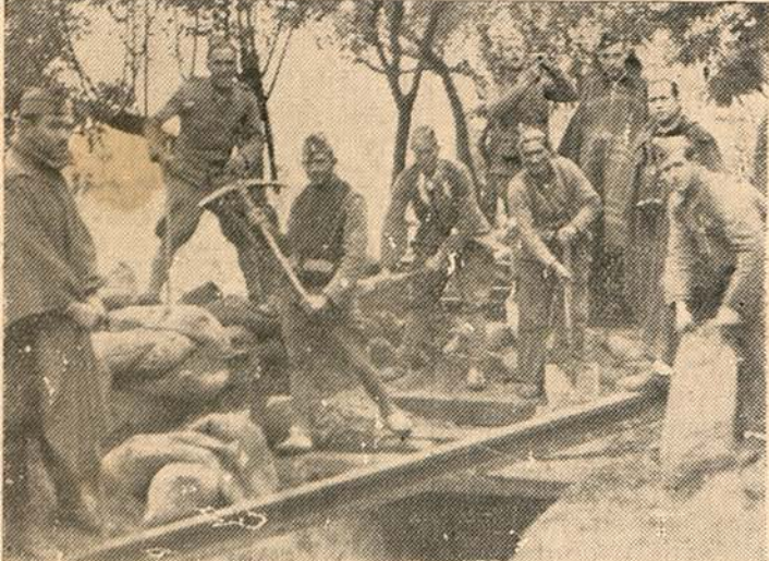
En la misma vanguardia empieza nuestra obra reestructiva. Nuestras fuerzas reconstruyendo una línea férrea deshecha en su huida por el enemigo