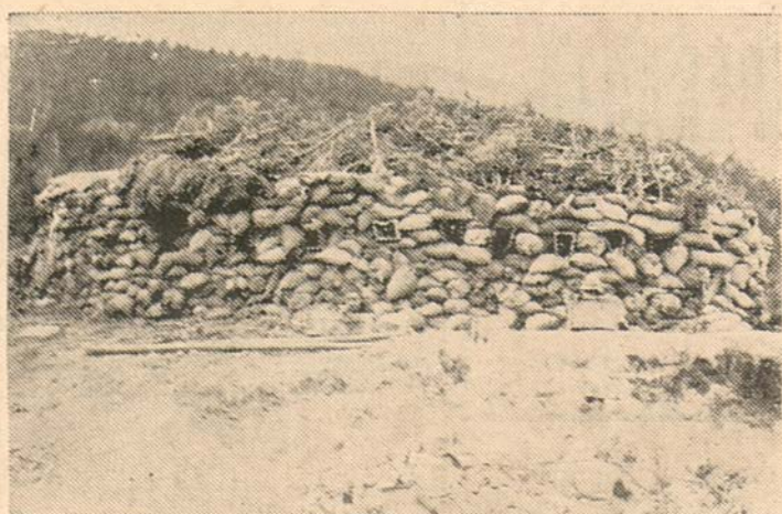
Un detalle de las posiciones cogidas últimamente al enemigo en Aravaca