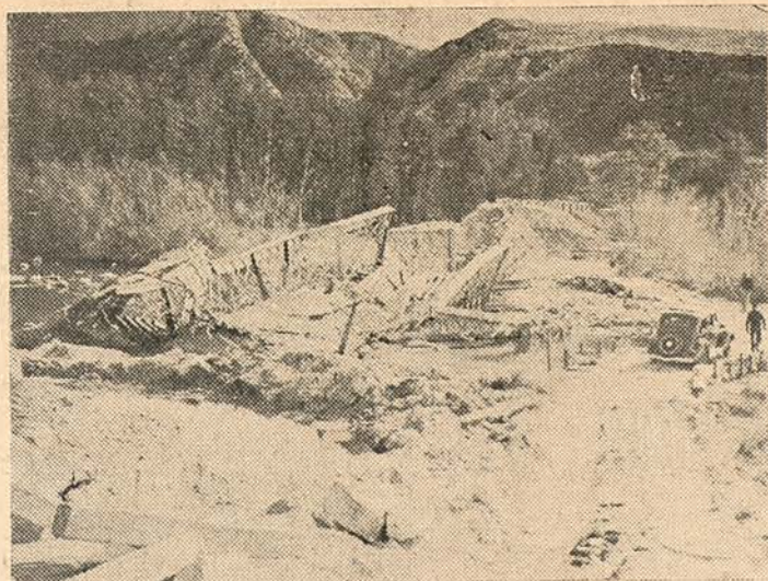
Puente destruido por los rojos en las cercanías de El Escorial