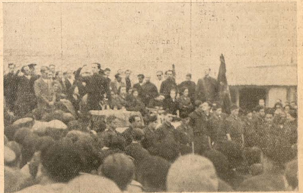
De entonces: Onésimo Redondo, el moldeador de las Jons, en un mitin dado en mayo del año pasado en Ríoseco