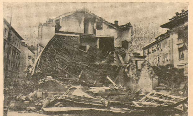
Efectos de nuestra Artillería reproducidos en el «A B C», de Madrid, que no puede ya ocultar nuestro avance