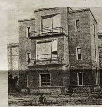
Pabellón de quirófanos.