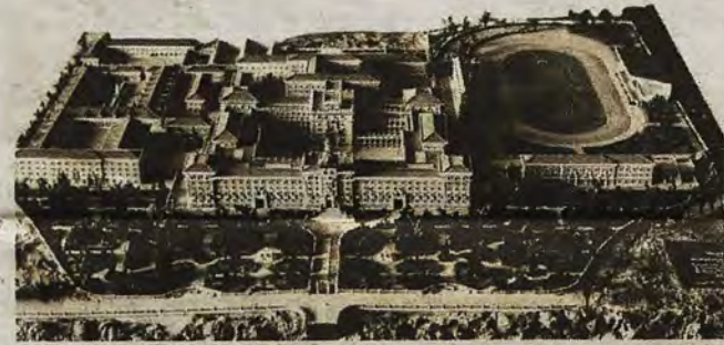
Maqueta de la Academia de Infantería elaborada en 1941 (Col. Particular).