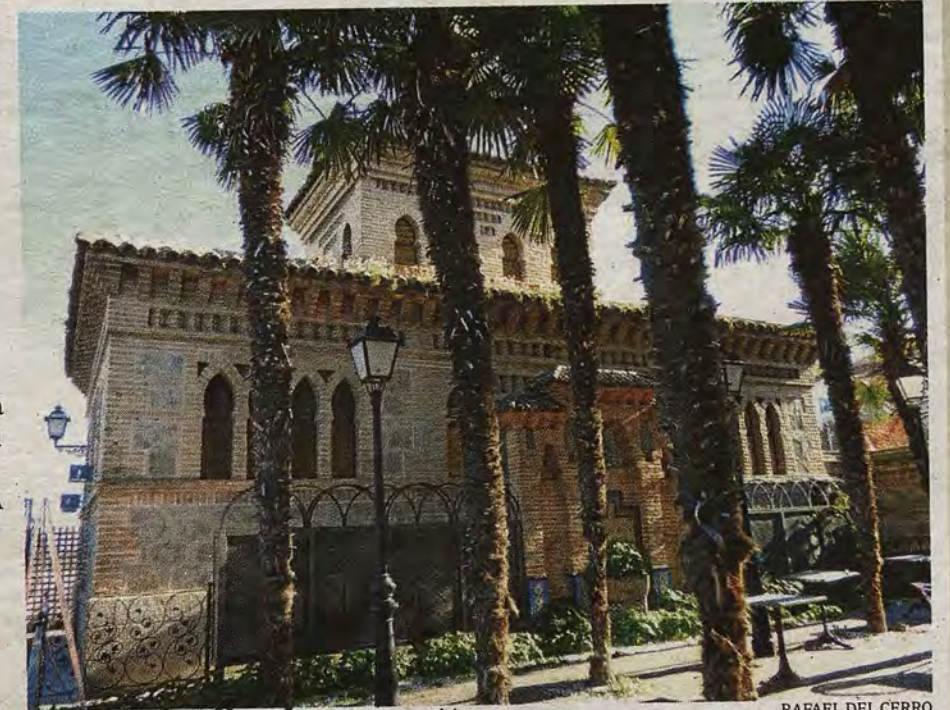
Rincón ajardinado de la Estación