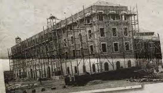
Construcción del edificio que alojó en 1948 la primera promoción de cadetes