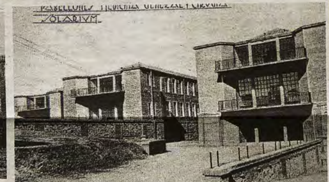
Proyecto Hospital Provincial (Col. Particular)