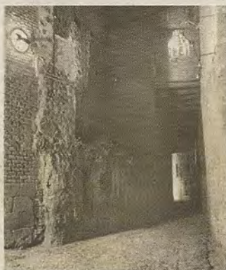
Indicador iluminado ante el Cobertizo de Santo Domingo el Real.