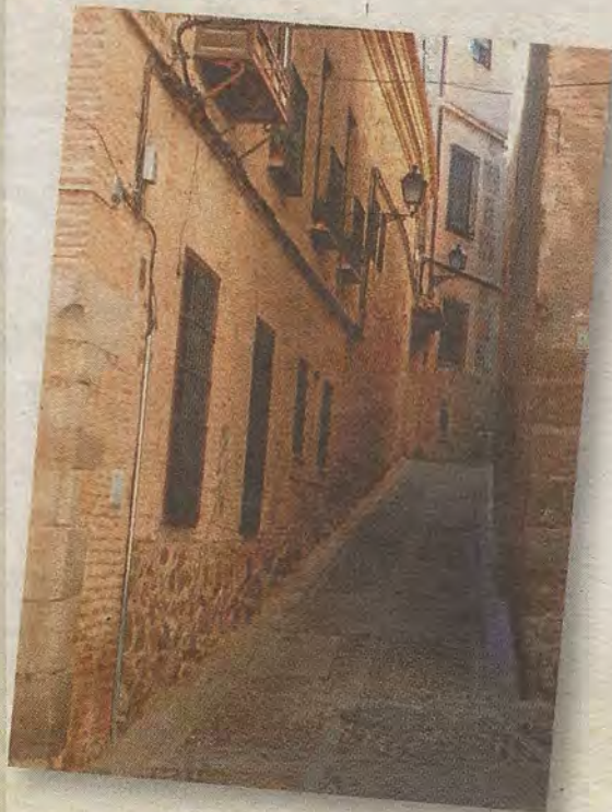
Encrucijada del antiguo itinerario nocturno.

Señal del recorrido nocturno en la esquina de la calle Carmelitas.