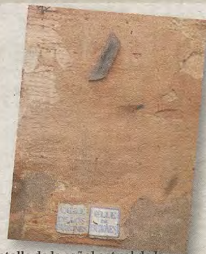
Detalle de la señal actual de la calle Buzones.