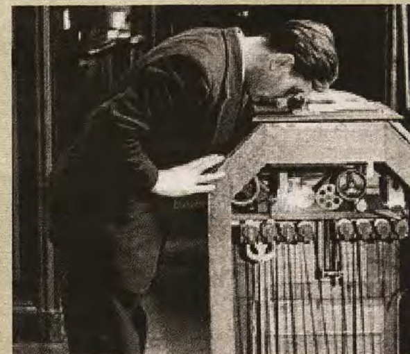
Kinetoscopio, patente de Edison, en 1891, para visionar películas de modo individual

ABC DOMINGO, 15 DE OCTUBRE DE 2017 abc.es/espana/castilla-la-mancha/toledo