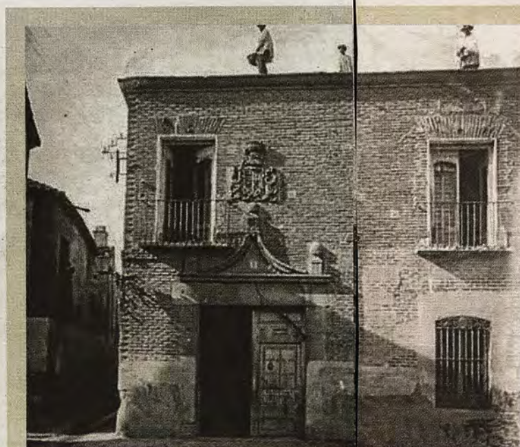
Edificio que acogió el primitivo Teatro Calderón de Talavera.

DOMINGO, 15 DE OCTUBRE DE 2017 ABC abc.es/espana/castilla-la-mancha/toledo