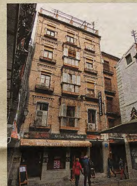
Edificio actual de la Calle de Barrio Rey donde estuvo un Cinematógrafo en 1898.