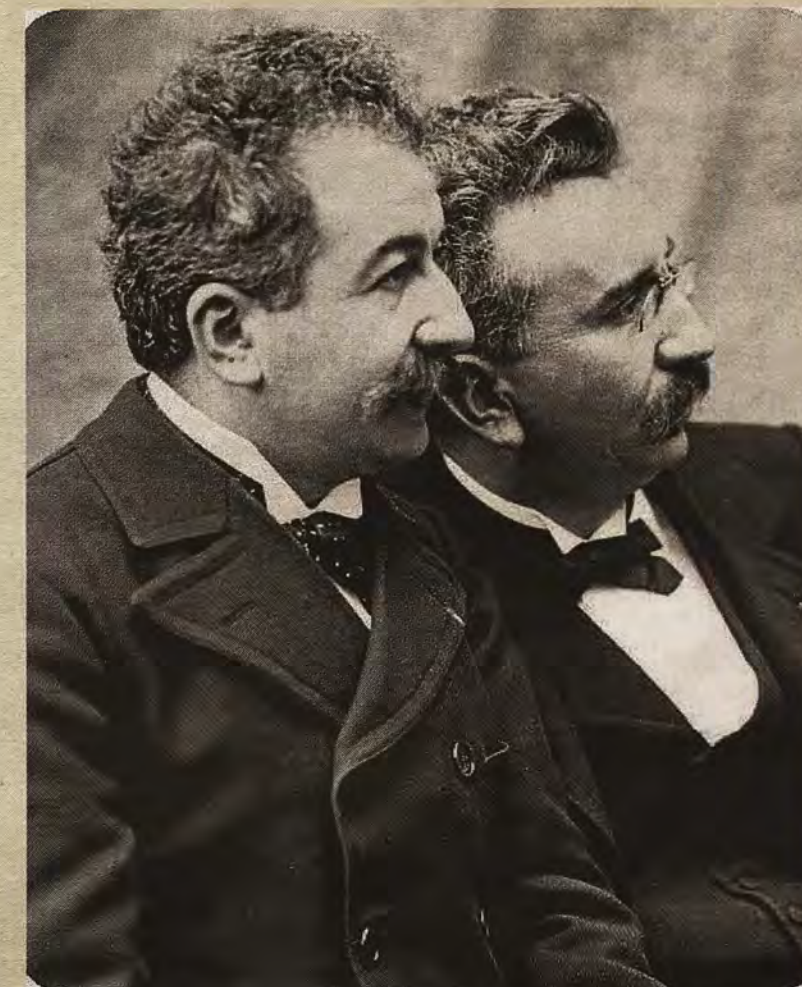
Los hermanos Auguste y Louis Lumière inventores del Cinématographe en 1895