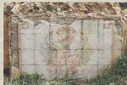
Frontal de la fuente que alimentaba la instalación. (R. del Cerro)