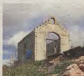
Restos de la capilla de la Venta del Hoyo. (R. del Cerro)