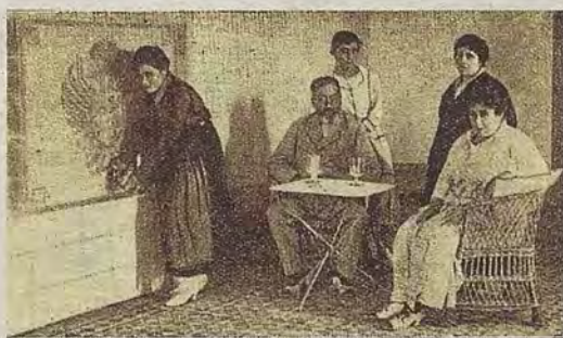
La familia propietaria ante la fuente del manantial.