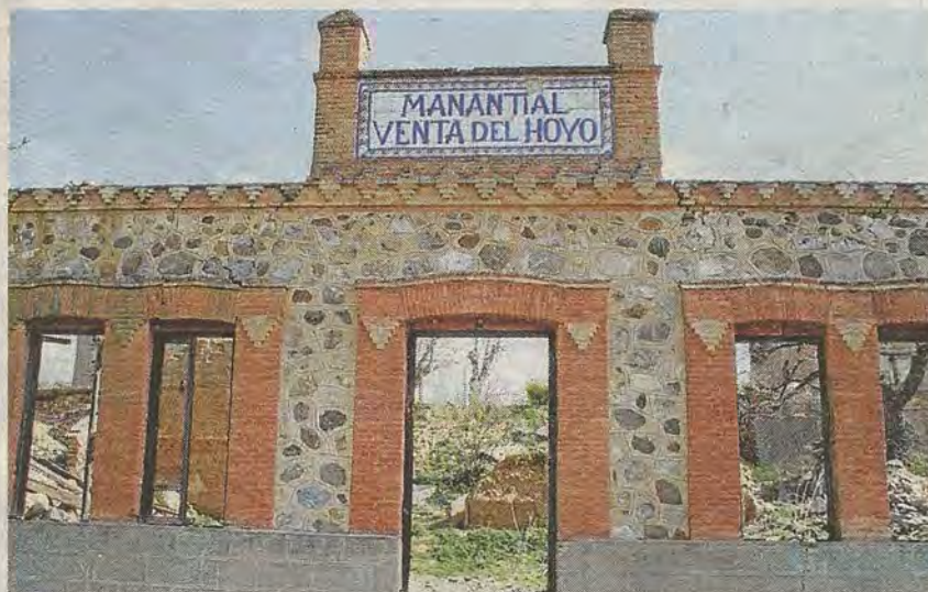
Entrada principal con azulejos de A. Pedraza

La publicidad de las botellas envasadas, además de llevar el águila imperial, proclamaba la condición de «aguas bicarbonatadas, nitrato sódicas y radioactivas» para curar la diabetes, habiendo sido analizadas por el bacteriólogo Santiago Ramón y Cajal. Se apuntaba la bondad para combatir la obesidad, así como el aval de estudios aparecidos en revistas médicas. El propietario se enorgullecía de atender pedidos solicitados desde cualquier lugar y clientes como Antonio