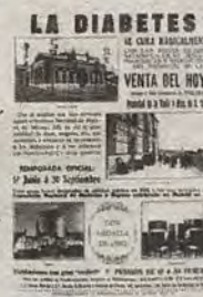
Publicidad de la Venta del Hoyo: aguas y hospedaje