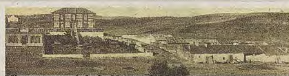
Vista general de la Venta del Hoyo en 1917.