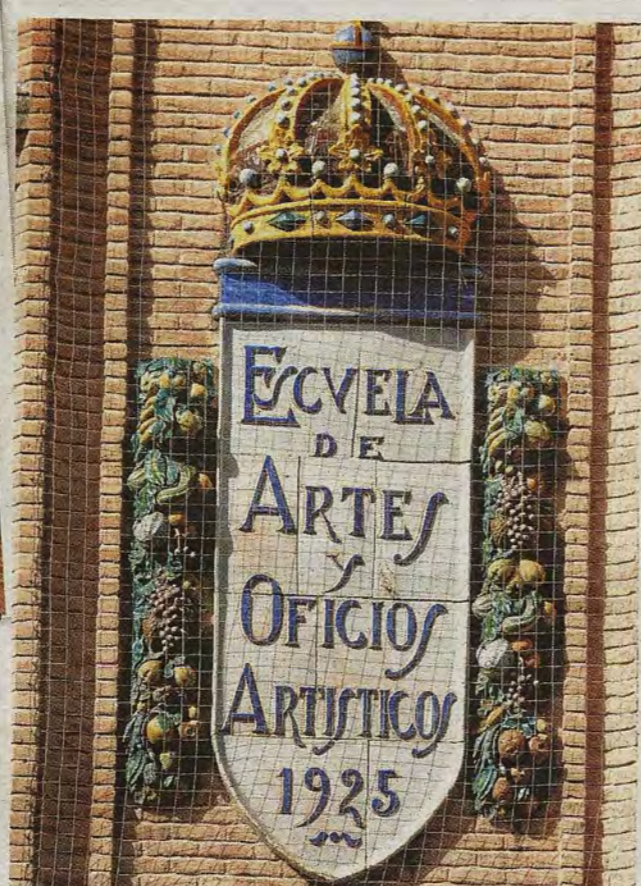
Detalle de la fachada principal.