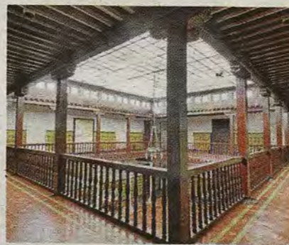
Galería superior del patio central