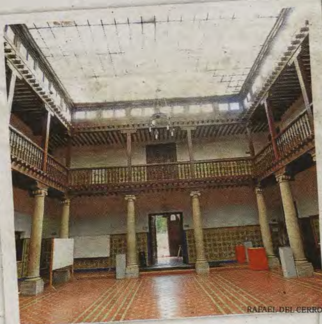
Patio central del segundo edificio

Iglesia de la Concepción de Madrid finalizada por Carrasco-Muñoz. Revista La Esfera 20 de mayo de 1915