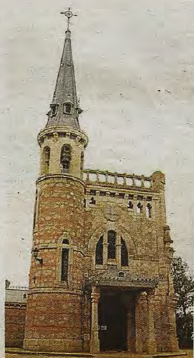
Ermita de los Pastores. Huerta de Valdecarábanos.

En 1895 Jesús acabó su formación en la Escuela de Arquitectura, trabajando luego con otros colegas para una selecta clientela que demandaba palacetes, villas o panteones de ecos afrancesados o historicistas.