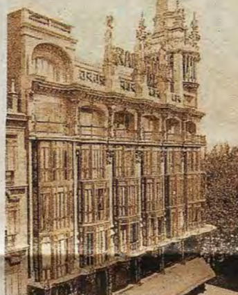
Publicidad del Hotel Reina Victoria de Madrid.