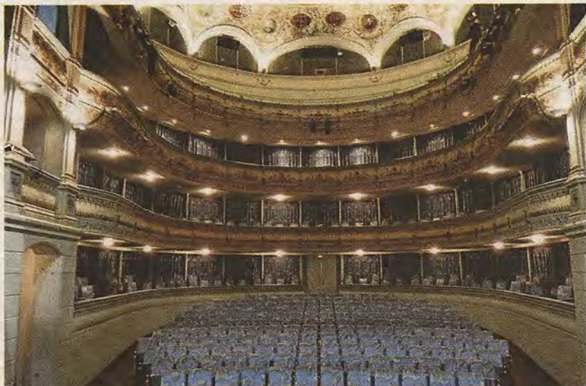
El patio de butacas con su disposición habitual