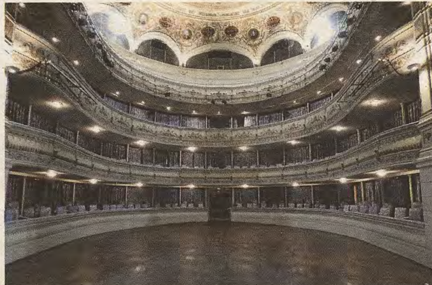
Embocadura del escenario sobre el patio de butacas