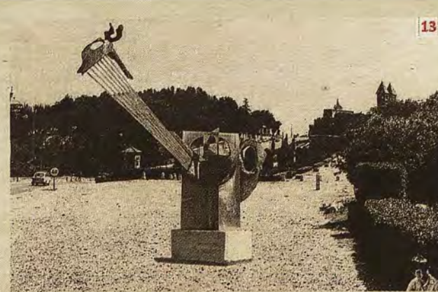
Fotomontaje nº 13. Propuesta de escultura junto al paseo de la Ronda