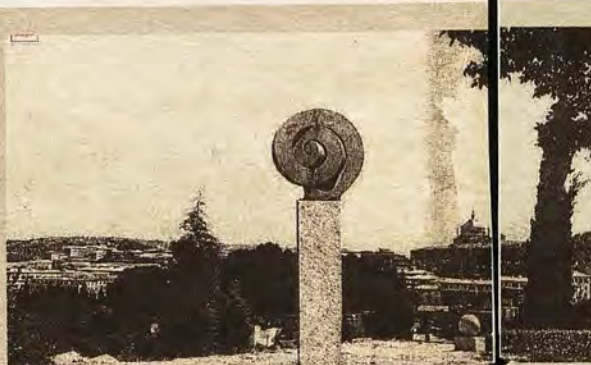
Fotomontaje nº 22. Situación de una escultura en el paseo de Recaredo