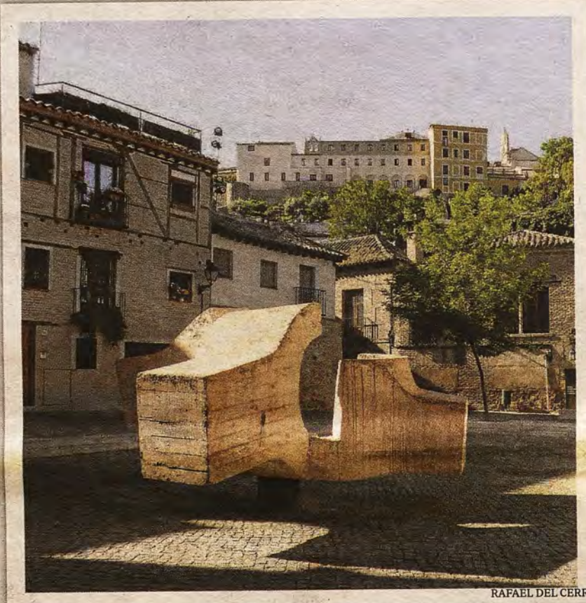
Plaza de Alfonso VI con la escultura de Eduardo Chillida en 2015

rio un lugar adecuado. El museo no podía estar en un ámbito cerrado. Debía ser «participativo y vivencial», fusionarse con el perfil urbano de Toledo, sin caer en un reparto de esculturas por toda la ciudad, ni competir con las rutas turísticas habituales. Había que «traspasar la mera frontera de las murallas para tener repercusiones hacia el resto de la humanidad». Se concluía que el paraje más idóneo era el comprendido entre las puertas de Bisagra y del Cambrón, al pie de las murallas (terreno remodelado en 1977), abierto a los cigarrales y las vegas del Tajo.