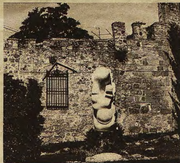
Fotomontaje nº 35. Ubicación elegida en la plaza de San Juan de los Reyes (Archivo Municipal de Toledo)