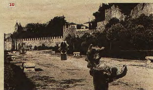
Fotomontaje nº 10. Disposición de varias esculturas bajo las murallas de la Granja