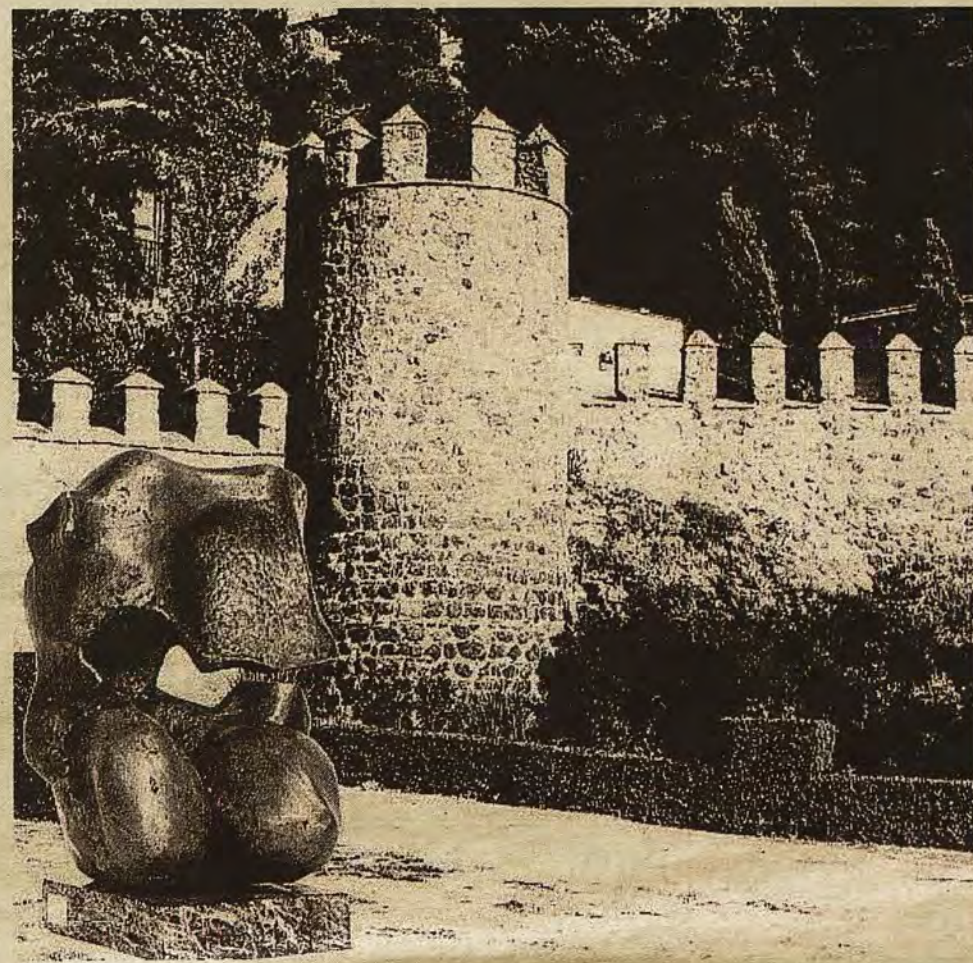
Fotomontaje nº 9 del proyecto del Museo de Escultura al Aire Libre. Obra cercana a la puerta de Alfonso VI.

gón, de 16 toneladas de peso, que llegó a Toledo en el mes de diciembre, procedente de Valencia tras su llegada de una exposición en Nueva York. Aquello parecía alumbrar ya el nacimiento museo. Sin embargo, la obra del artista donostiarra permaneció diez meses embalada en un cajón, en tanto se estudiaba su destino.