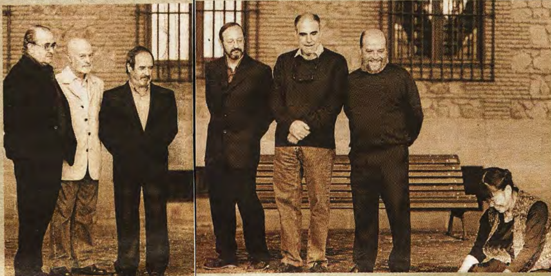
Algunos miembros del grupo Tolmo en la plaza del Ayuntamiento de Toledo.