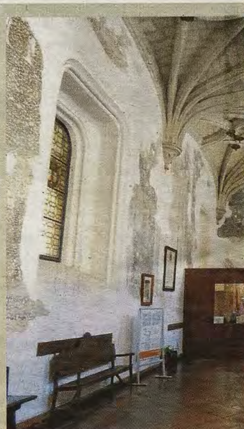
Aspecto actual del vestíbulo que acogió la primera sala del Museo Provincial