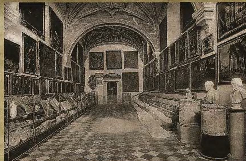
Primera sala del Museo Provincial en San Juan de los Reyes Foto de León & Levi hacia 1886