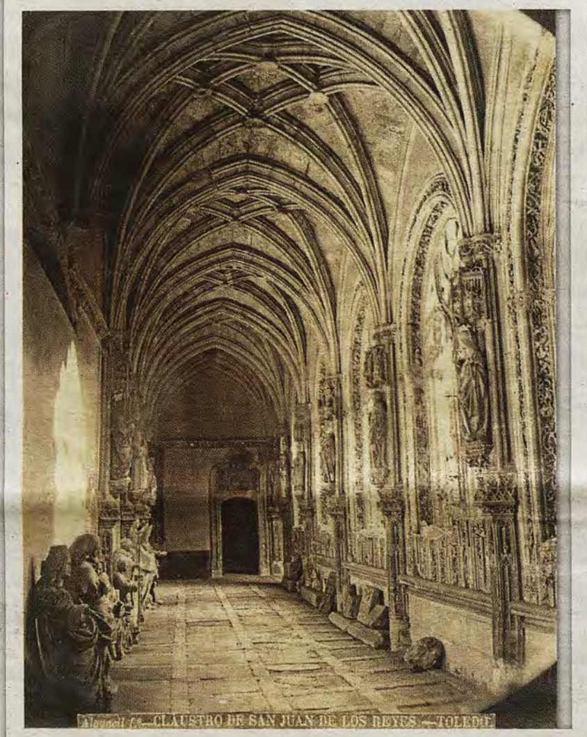
Lápidas y esculturas en San Juan de los Reyes hacia 1880.

La entrada al Museo era por la antigua portería, alojada bajo una cruz coronada por el símbolo del Pelicano. El acceso ocupaba un cuerpo saliente en la calle de Reyes Católicos que, a mediados del XX, se suprimió para alinear dicha calle. La colección arrancaba en el zaguán, proseguía por la antigua sacristía, la escalera y terminaba en otros dos espacios superiores. En 1849 se contrataban los celadores y se fijaban los horarios de visita. Por entonces solían acudir pintores, escritores, historiadores y viajeros inmersos en el hervor romántico, ávidos de