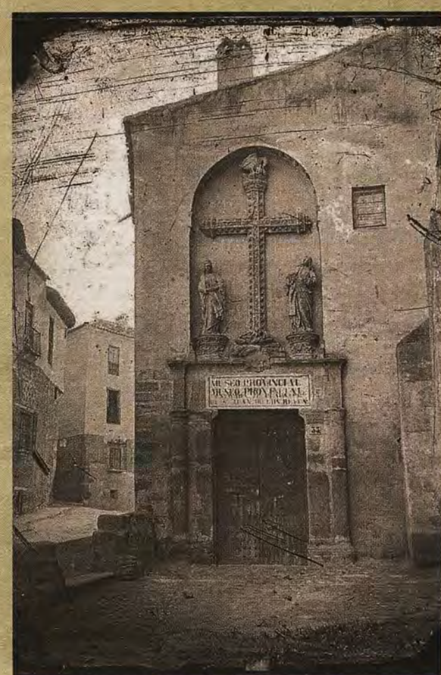
Puerta del Pelicano en San Juan de los Reyes hacia 1880.