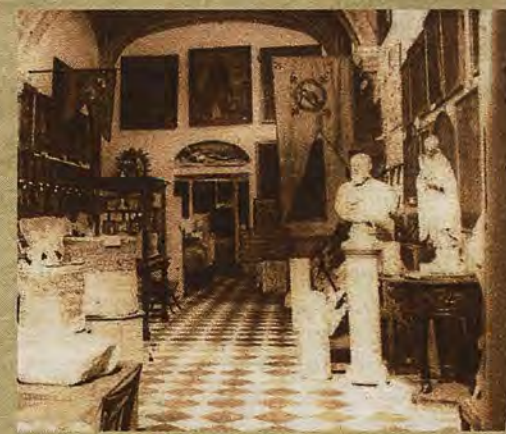
Primera sala del Museo Provincial en San Juan de los Reyes.

tentes» elevasen para aclarar cualquier dato relativo a las piezas expuestas.