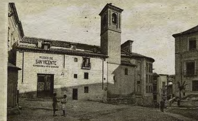
Exterior de la iglesia de San Vicente hacia 1931.