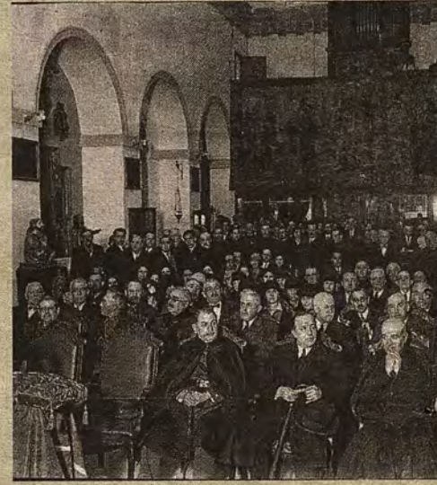
Acto inaugural del museo el 29 de abril de 1929

DOMINGO, 7 DE ENERO DE 2018 ABC abc.es/espana/castilla-la-mancha/toledo