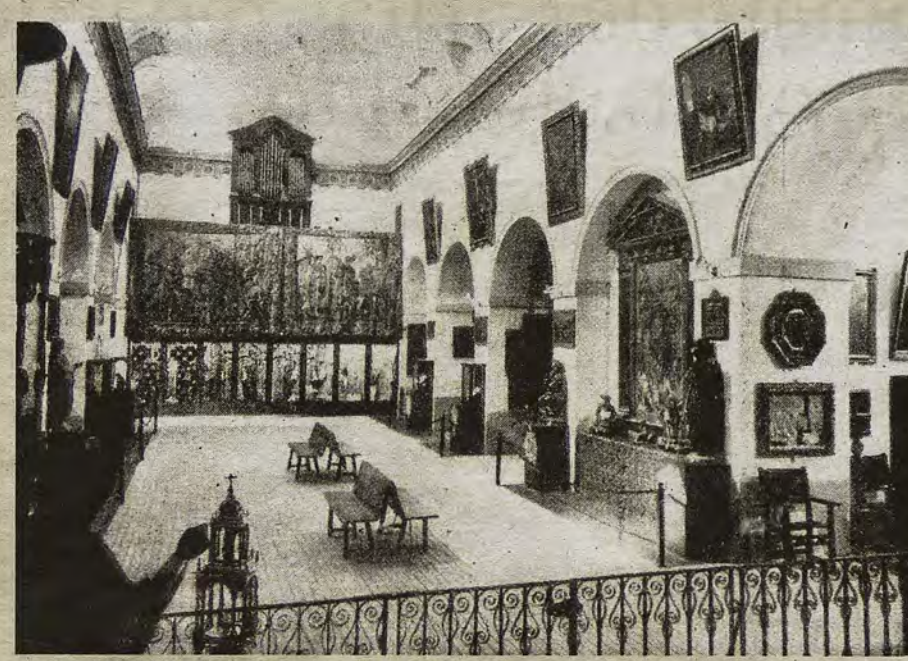
Interior del Museo Parroquial en la iglesia de San Vicente en 1929

ABC DOMINGO, 7 DE ENERO DE 2018 abc.es/espana/castilla-la-mancha/toledo