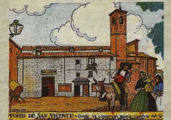
Postal publicitaria del Museo Parroquial de San Vicente hacia 1950.

francés Édouard Herriot en 1932, además de excursionistas ilustres, periodistas, rotarios o miembros de la Institución Libre de Enseñanza. En 1948 se acercó Humberto II de Saboya (1948) y, en 1960, el secretario general de la Sociedad de Naciones, el sueco Dag Hammarskjöld.