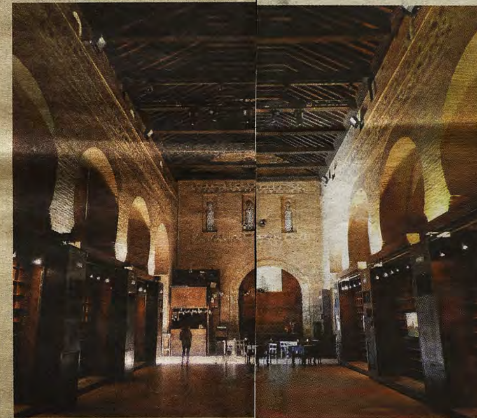
Aspecto de la iglesia de San Vicente en 2015