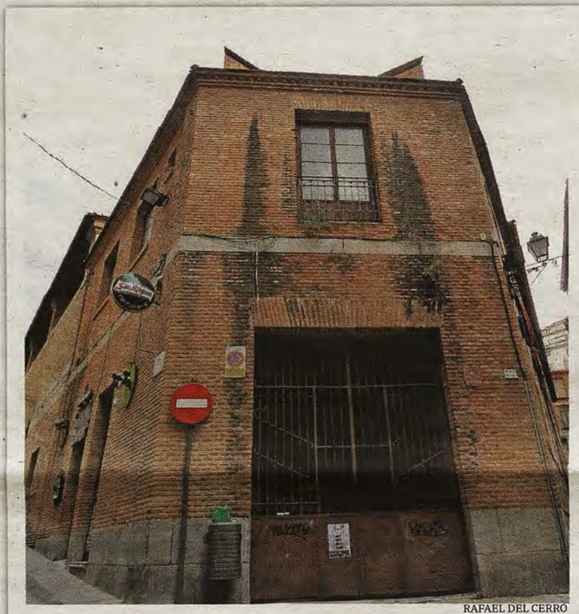
Acceso a la planta baja en 2014.

El paso del tiempo y un escaso mantenimiento causaban continuos arreglos y gastos. En 1891, el arquitecto municipal denunciaba la ruina de varios arcos cuya reparación ascendía a unas cuatro mil pesetas. Cuando se inauguró el nuevo matadero municipal junto a la puerta del Cambrón, en abril de 1892, se vio su contraste con la vieja lonja de la plaza Mayor, ya con escasas condiciones higiénicas, pues aquí era donde se vendería después la carne. Así pues, el cierre se decretó