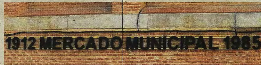
RAFAEL DEL CERRO