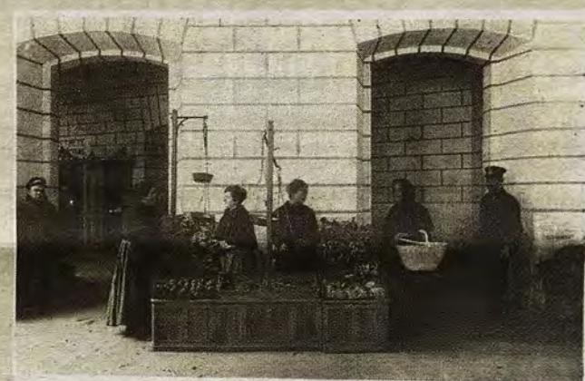
Puesto de verduras en el Mercado.