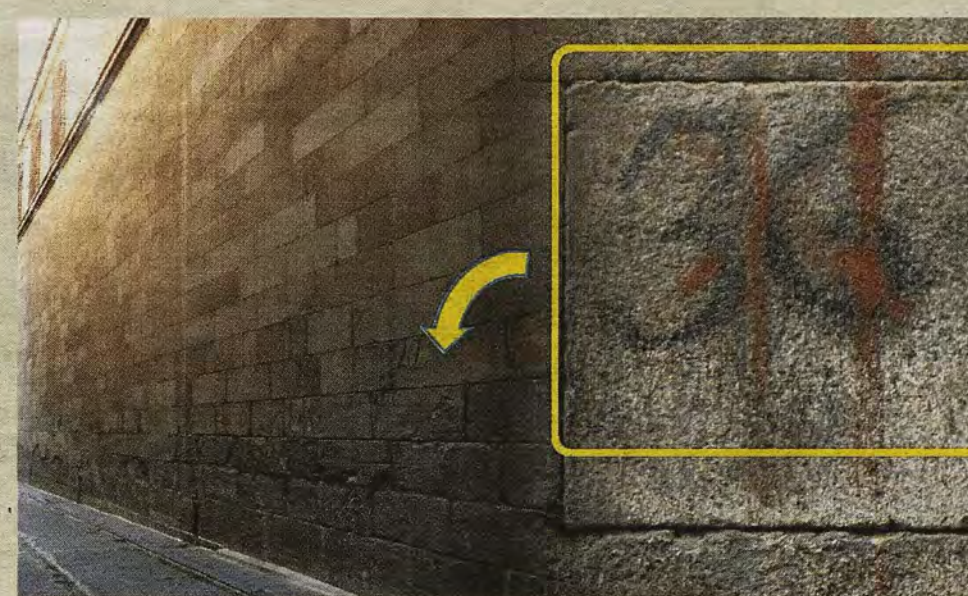
RAFAEL DEL CERRO