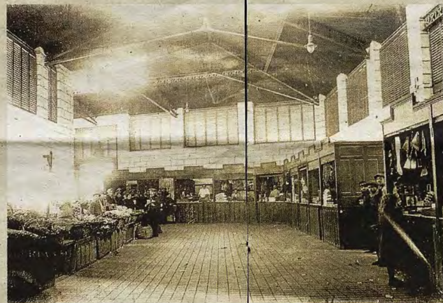
Interior del Mercado en sus primeros años.