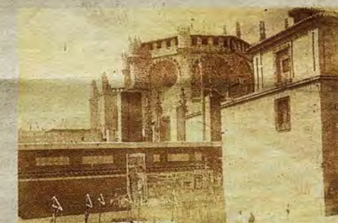
Aspecto del Mercado, aún sin concluir, en 1905.