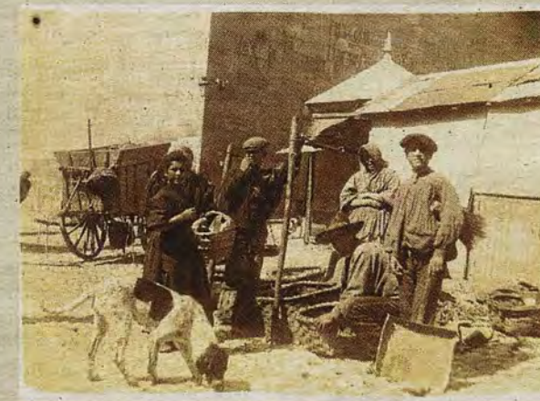
Puestos y vendedores en la plaza Mayor en 1905.