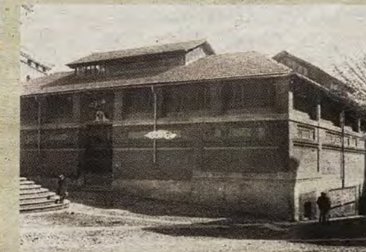
Mercado Municipal de Abastos poco tiempo después de abrirse en 1915.

la nave de ventas. Tal hueco se cegaría en la reforma que se efectuó en 1985 para lograr así más superficie comercial. Señalemos que, en 1914, las fachadas exteriores fueron picadas para eliminar el rojizo ladrillo satinado, común en la arquitectura del XIX, y colocar rústicas piezas de evocación mudéjar.