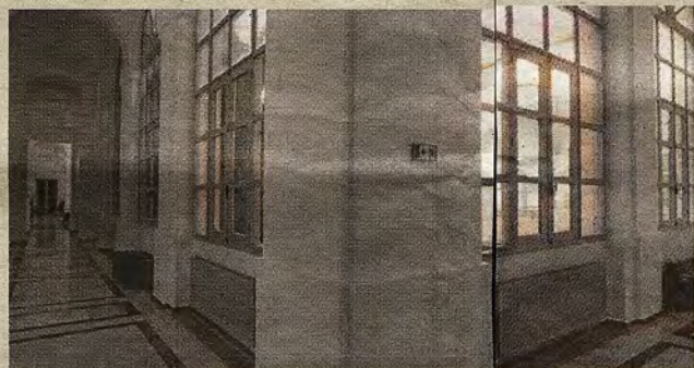
RAFAEL DEL CERRO Galerías circundantes en uno de los cuatro patios interiores