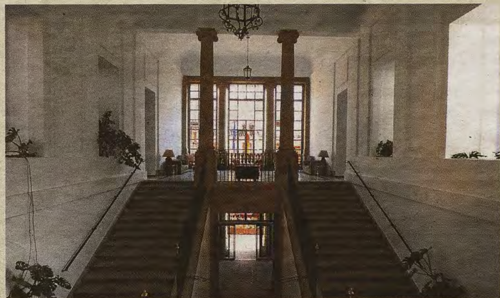
Escalera principal entre el zaguán de la planta baja y el vestíbulo superior

ABC DOMINGO, 13 DE ENERO DE 2019 abc.es/espana/castilla-la-mancha/toledo