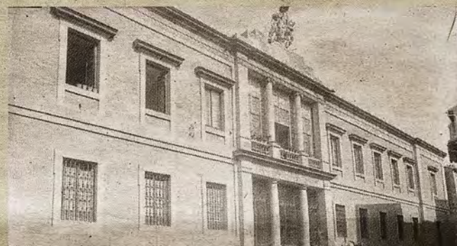
Edificio del Nuncio Nuevo fotografiado por Casiano Alguacil hacia 1880. (Archivo Municipal de Toledo)