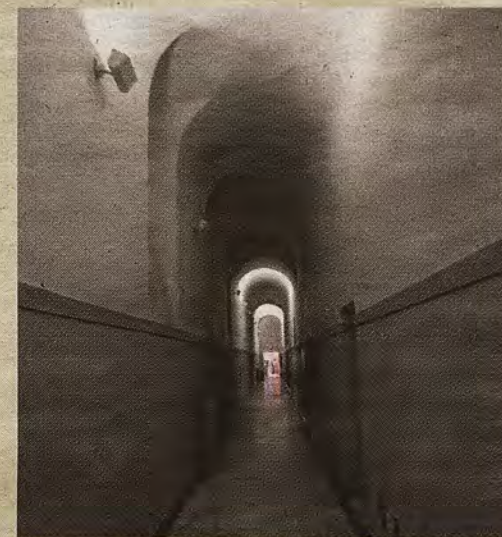
FOTOS: RAFAEL DEL CERRO Galería del semisótano comunicada con la Corraliza del Nuncio y el jardín posterior

Después, al estar vacío de pacientes, como cuartel de fuerzas hasta finalizar la contienda. En 1939 volvería la función hospitalaria, cesando en noviembre de 1976, al trasladarse a unas nuevas instalaciones en Azucaica. Entre 1978 y 1984 se hicieron obras parciales para acoplar aulas universitarias –uso nunca aplicado–, y una fugaz residencia de ancianos. En noviembre de 1985 concluyó la total remodelación del edificio para albergar servicios de la administración autonómica de Castilla-