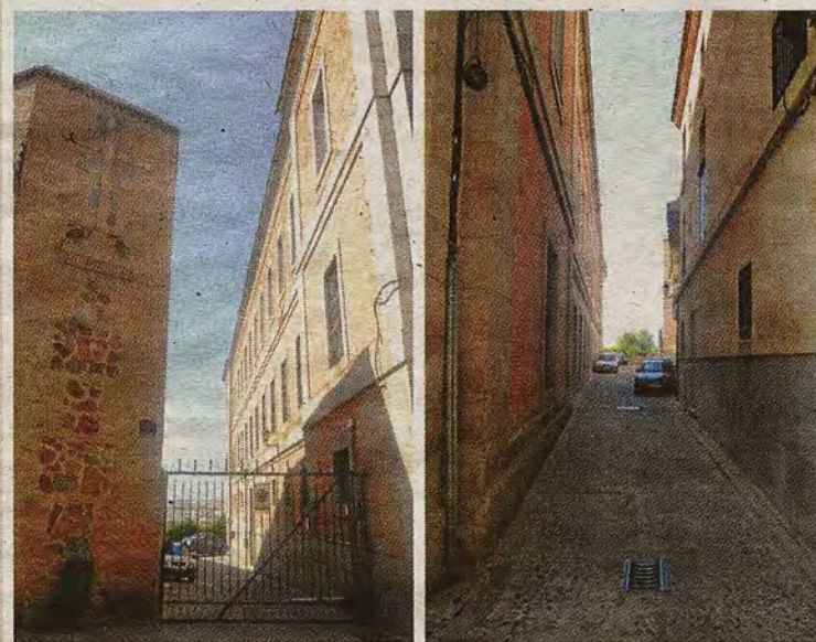
Adarnes laterales del Hospital. A la izquierda, la Corraliza del Nuncio. A la derecha, el callejón de Justo Juez