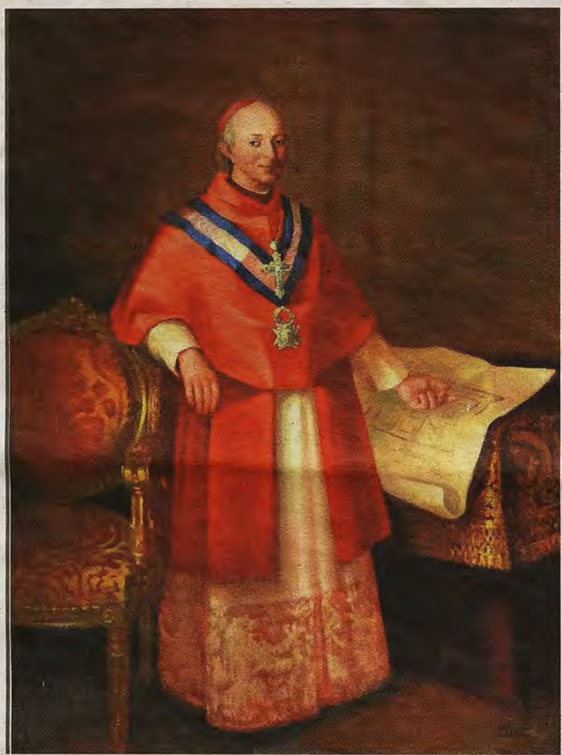
El cardenal Lorenzana. Óleo de Romero Carrión (1973). Vicerrectorado de la Universidad de Castilla-La Mancha en Toledo

Las fachadas se resuelven con ladrillo y piedra labrada en la línea de impostas, perfiles o en el zócalo inferior, con una ordenada disposición de