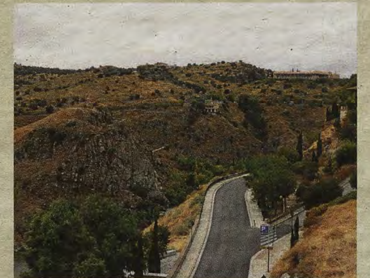
Paraje de la Ronda Cornisa en 2018 donde estuvo el Corral de Vacas

Guerra civil, después el Parque sería un capitulo cerrado. El edificio se convirtió en un precario almacén y en peñera, donde los laceros municipales dejaban los canes recogidos en la calle -abandonados o sin identificar-, conforme a una norma estatal de 1955, algo que la ciudad ya había regulado, en abril de 1907, a través de un bando del alcalde José Benegas que informaba sobre un reglamento municipal dedicado a este asunto.