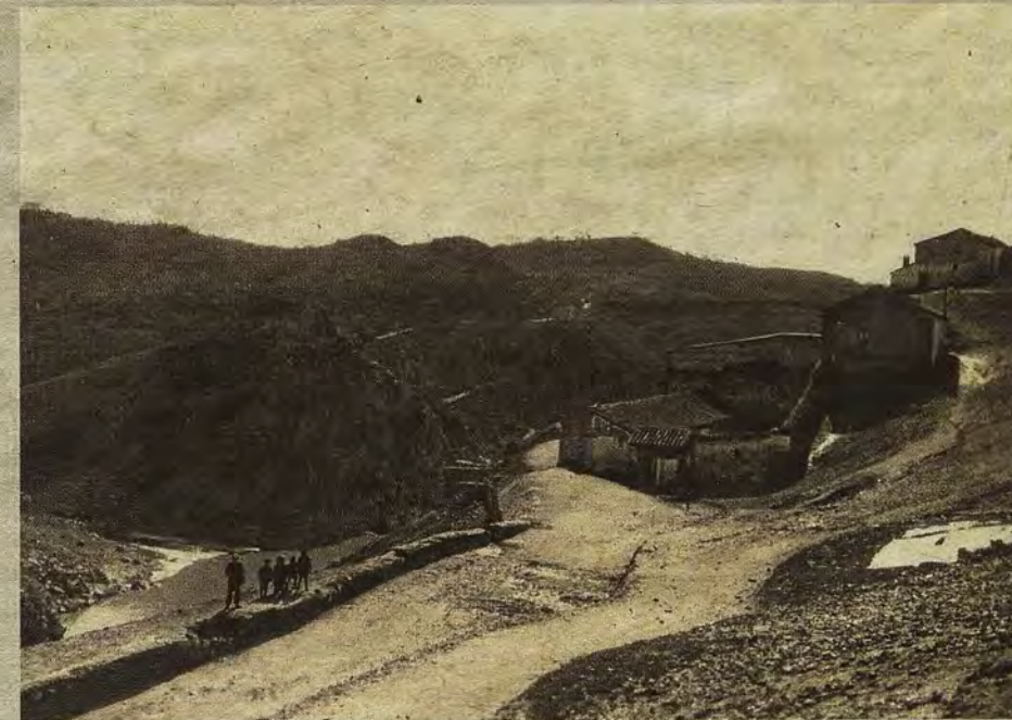
Aspecto del antiguo Corral de Vacas hacia 1920.

ABC DOMINGO, 4 DE NOVIEMBRE DE 2018 abc.es/espana/castilla-la-mancha/toledo