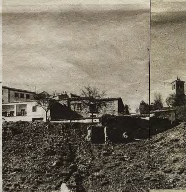
Vista lateral del Corral de Vacas en 1963. Al fondo la torre de San Miguel.