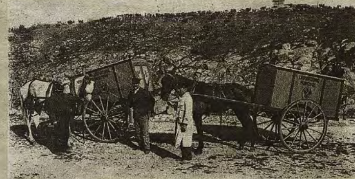
Empleados y material de la Estación de Desinfección.