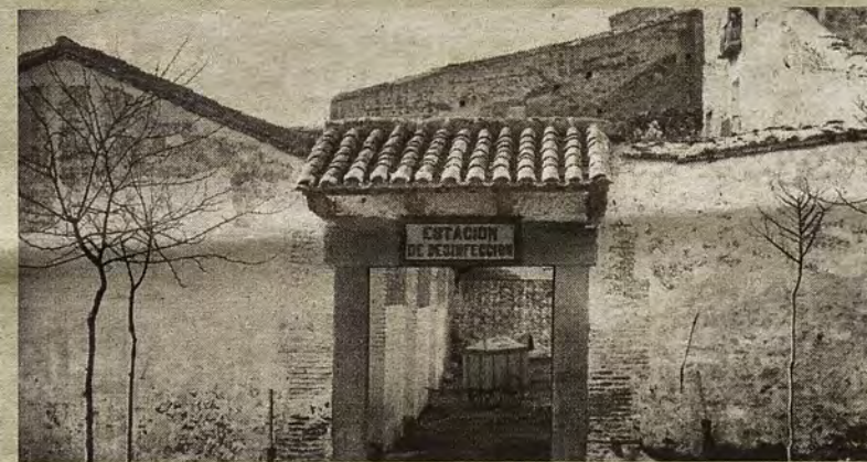
Entrada a la Estación de Desinfección en el antiguo Corral de Vacas hacia 1920.