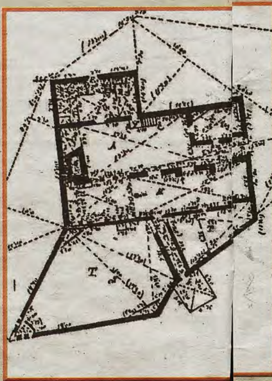
Estructura del Corral de Vacas en un plano del Instituto Geográfico y Estadístico de 1881

DOMINGO, 4 DE NOVIEMBRE DE 2018 ABC abc.es/espana/castilla-la-mancha/toledo