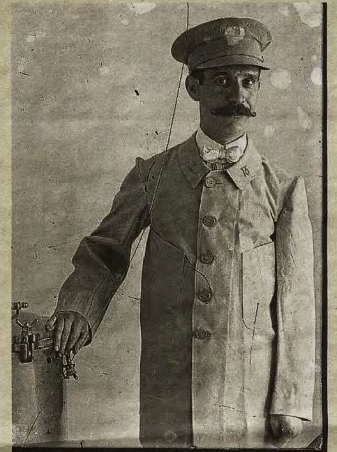
Empleado del Laboratorio Municipal de Higiene (ca. 1910) fotografiado por Casiano Alguacil. Archivo Municipal de Toledo