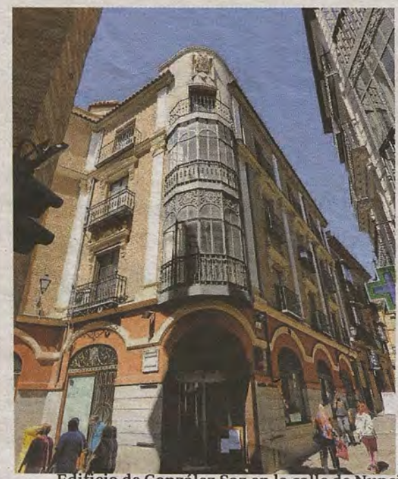
Edificio de González Saz en la calle de Nuncio Viejo 1, esquina Trinidad

Programa de la proyección inaugural del nuevo Cine Moderno en 1932.