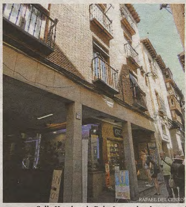
Calle Hombre de Palo. Lugar donde estuvo el primitivo acceso al Cine Moderno