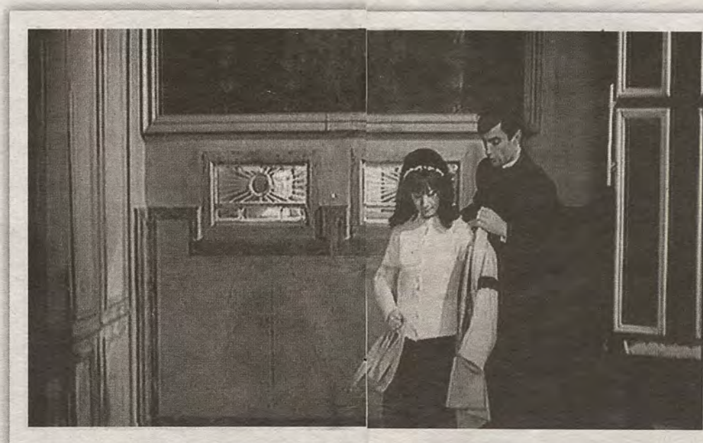
Taquilla del Cine Moderno, en un fotograma de la película El Buen Amor