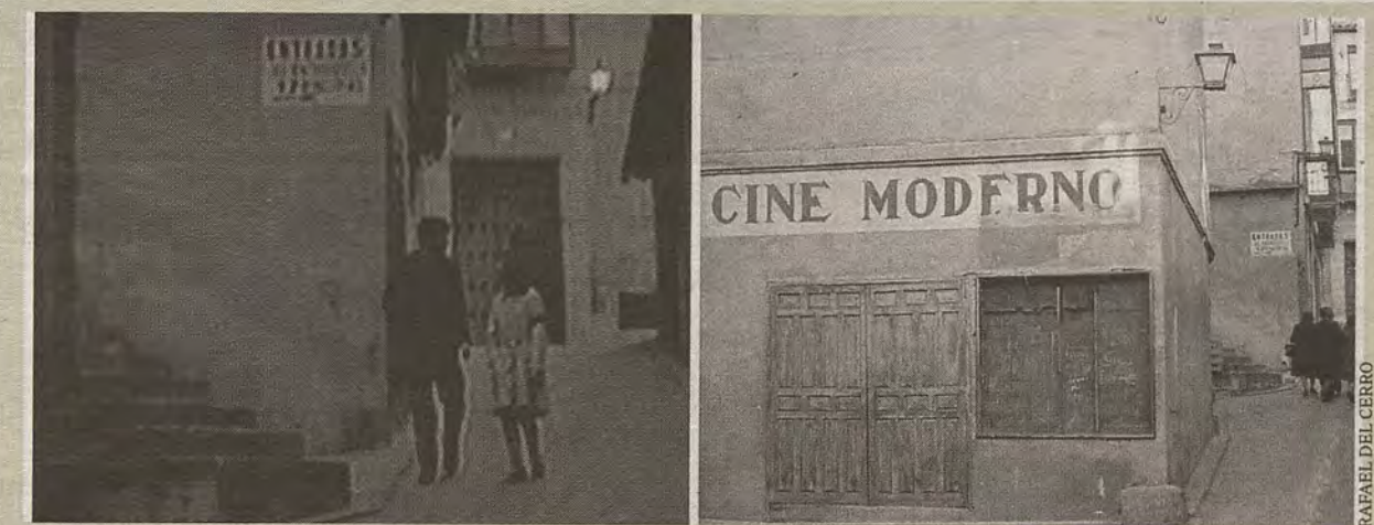
Calle de la Sinagoga en la película El Buen Amor (1963) y con el Cine Moderno ya cerrado en 1975