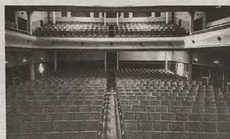
Vista del patio de butacas y el entresuelo en los años sesenta.