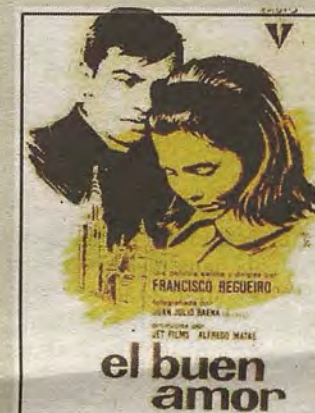
Cartel de la película El Buen Amor de Francisco Regueiro