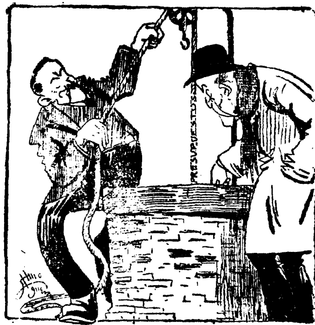
Moret.—Tira, tira, yo cogeré el caldero.

¡Oh, festivos lectores, pobre del rimador en los romanos tiempos de la indemnización en miles de pesetas... que borre el deshonral Y, es capaz de pedirle