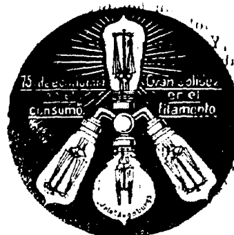
Se hacen instalaciones. Se mandan gratis planos y presupuestos.

Material eléctrico para luz, timbres y teléfonos.—Maquinaria eléctrica.—Aparatos para gabinetes y escuelas.—Arañas-brazos.—Cristalería.—Arcos voltaicos.—Aparatos de calefacción, ventilación y cocina eléctrica. Lámparas de filamento metálico de todas las marcas y voltajes de Toledo y su provincia, desde 2 pesetas.—Lámparas corrientes, desde 0,50 idem.