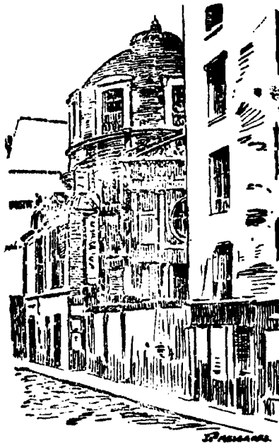
Hotel de los estudiantes.

Pero Toledo es ya sólo un recuerdo y París una realidad.