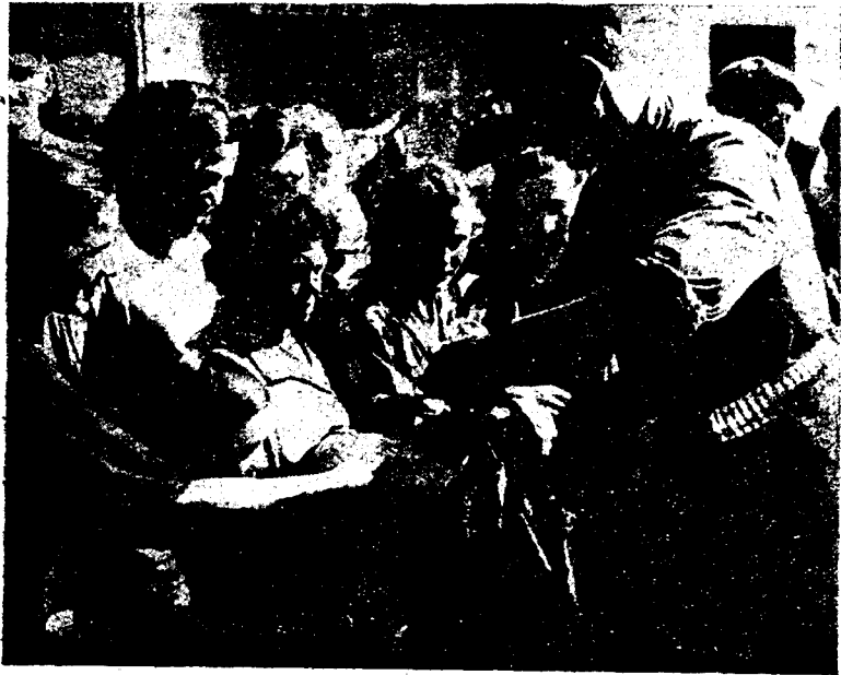
Liberada la ciudad, nuestros soldados, ante el júbilo de los vecinos, reparten alimentos de que éstos carecían.