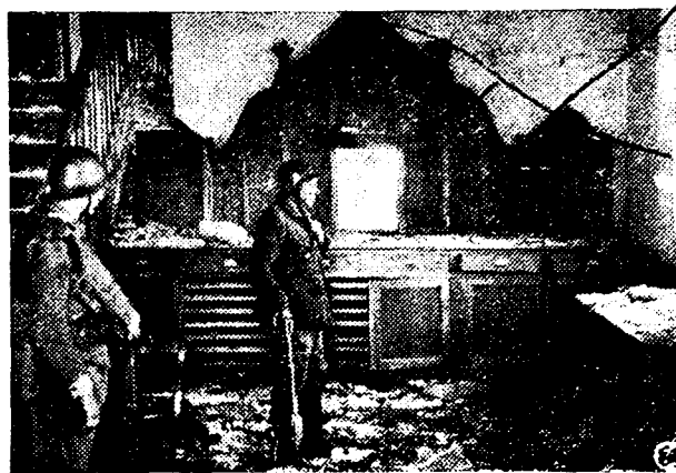
Altar mayor de la iglesia de San Miguel, de Benagoitia, profanada por los rojos