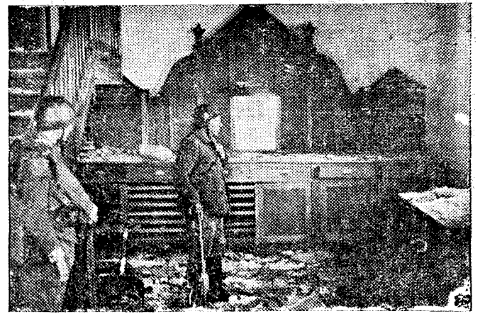
Altar mayor de la iglesia de San Miguel, de Benagotia, profanada por los rojos