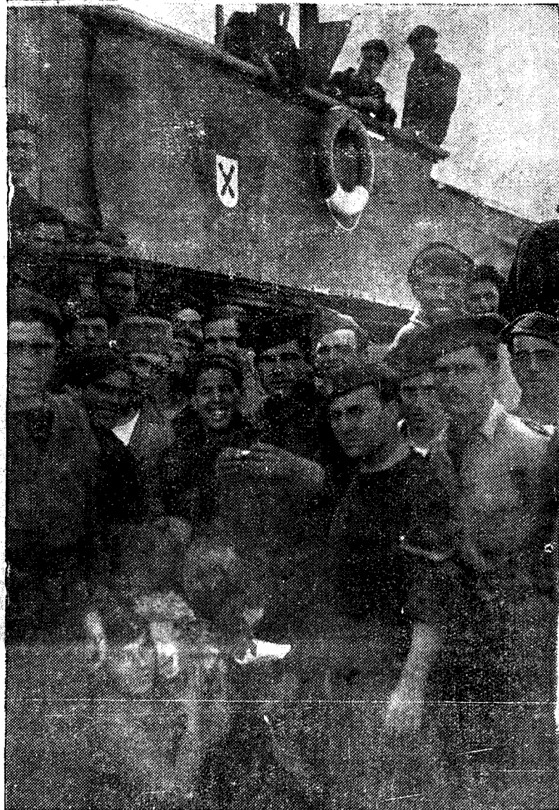
Los marinos del magnífico "Ba'eaes", hermano en esplendidez y va entía del "Canarias", han sido fotografados con su mascota. En el frontón del puente de guardia la cruz de Borgoña marca el signo del supremo heroísmo que boga con el crucero en la fe inquebrantable de sus tripulantes.

El «compañero» Lorenzo, mecánico de aviación, salió a la lucha del aire pilotado por un extranjero. Y el compañero Lorenzo ha caído en esta misma cabina desde donde yo me burlo del espeso granizo. ¿Qué será de tí, compañera cuyo nombre