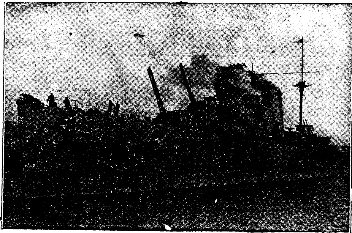
El «Canarias», gloria de la Marina nacional y alto exponente de heroísmo y eficiencia al servicio de la santa Cruzada. Como en Lepanto, la escuadra española, instrumento de Hispanidad y de Civilización cristiana, triunfa de los enemigos de la Fe y de la Patria con señaladas victorias y arriesgados servicios que pregonan el valor y la técnica de nuestros bravos marinos.