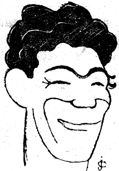
Max Baer, que días pasados venció en Londres por K. O., en el noveno asalto, a Ben Foord

N. de R. Aún no hemos recibido noticias del resultado de la carrera.