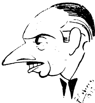
Don José M. Pemán. Presidente de la Academia Española

Salamanca, 6 (madrugada).— Hoy, a las once de la mañana, se retransmitirá el acto que se celebrará en el Paraninfo de la Universidad, y en el que las Reales Academias procederán al solemne juramento y constitución del Instituto de España.