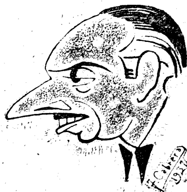
Don José M. Pemán, Presidente de la Academia Española

Hoy a las once de la mañana se retransmite el acto de constitución del Instituto de España