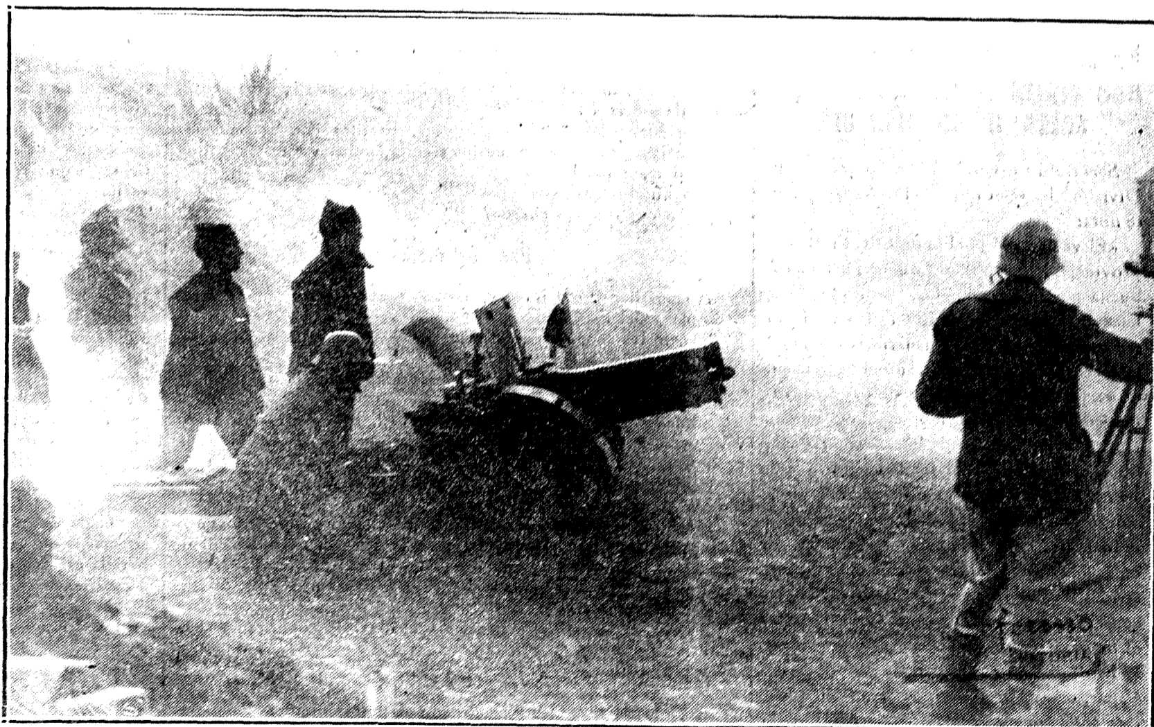
En plena refríega... El telémetro, en primer término. Con arreglo a las observaciones ópticas y a las indicaciones del mando, las piezas lanzan sus obuses sobre los objetivos enemigos. Nuestros bravos artilleros, envueltos por la humareda de los disparos e indiferentes a los horribles estampidos, permanecen inmóviles, abnegadamente atentos a sus deberes para con la Patria

La superioridad de la autoridad del padre en el hogar queda anulada, y ambos cónyuges están obligados a velar por el cuidado y alimentación de la prole.