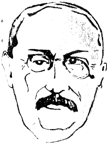
BLUM, el ministro francés vendido a los rojos españoles y a la Unión Soviética, cuya política lleva a Francia por los mismos derrotos que llevaron a España los ministros que se vendieron al oro moscovita. Francia sentirá pronto los efectos de su nefasta política, que, no contento de venderla contra una nación amiga, la ha puesto contra su patria misma.

París, 4.—Se dice que el Gobierno francés del Frente Popular tiene preparado un nuevo envío de material de guerra para los rojos españoles. Entre dicho material figuran 27 aviones de bombardeo y algunos de caza. (D. N. B.)